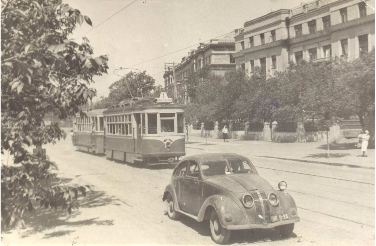
Трамвай проходить по вулиці Леніна (2 липня 1946 року).

1946 року почали долатись стахановськими методами, шляхом перевиконання виробітку на дві або три норми, адже колектив криворізького трамваю зобов'язався завершити всі роботи до Міжнародного дня праці [4, с. 2].