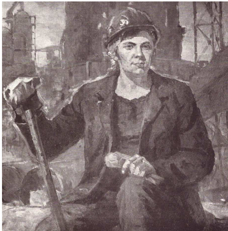
Й. Білополий. Бетонниця Луценко. по. 1974 р.

промислових гігантів, бурхливим ритмом діяльності бригад молодих будівників, він небезпідставно стає автором ряду монументальних індустріальних краєвидів. Під розмахом його пензля народжуються величні і урочисті, вражаючі симфонією кольору та динамікою композиції сюжетні композиції, одна з яких присвячена славнозвісному будівництву криворізької ДП-9: «На землі криворізькій», п/о, 1974 р. [3].