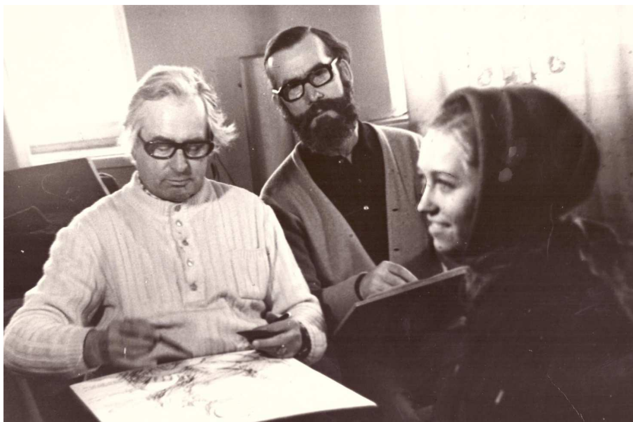
Художники з Німецької Демократичної Республіки на ДП-9.

кіоски, медпункти та інші зручності. Прибували митці не лише з Кривого Рогу, а й Дніпропетровська, Києва, навіть із-за кордону (НДР). День-у-день, разом з монтажниками, мулярами, зварниками приходили сюди живописці, графіки, скульптори. Сотні етюдів і замальовок, зроблені з натури, стали своєрідним мистецьким літописом трудових буднів і свят домнобудівників, цінним документальним матеріалом, який відображає окремі етапи і процеси роботи різних бригад, а також індивідуальний внесок у загальну справу конкретних особистостей.