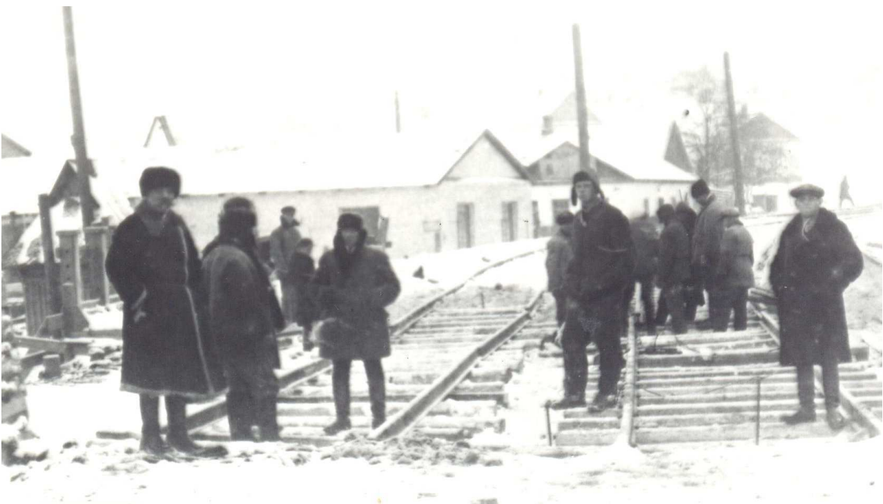
Відновлення трамвайної лінії (1945-1946 роки).

Державною комісією було затверджено нову план-схему трамвайних маршрутів міста, що передбачала збільшення швидкості пересування за рахунок запровадження двоколійного руху, без зайвих стрілок та роз'їздів. По суті мова йшла про спорудження нової мережі [2, с. 22]. З метою прискорення відбудови управління трамваю