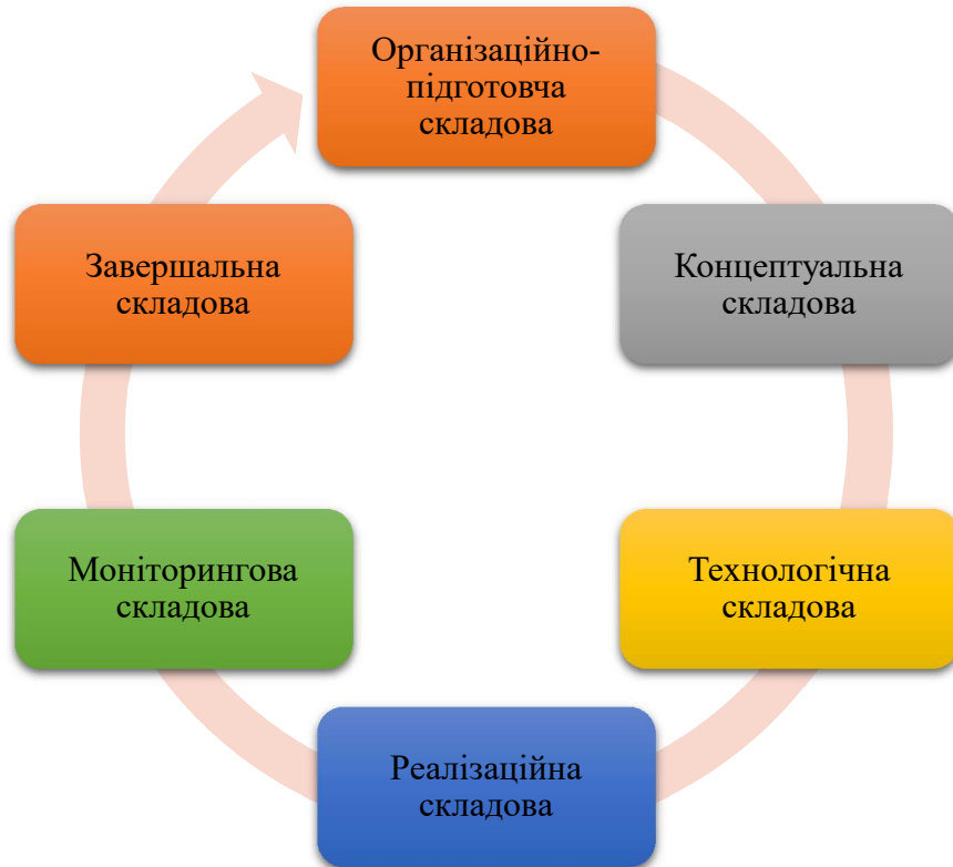
Рис. 3. Модель управління інвестиційними процесом ЗВО у циклічному вигляді

Запропоновано модель організації управління інвестиційною діяльністю ЗВО, яка включає в себе шість складників: організаційно-підготовчий, концептуальний, технологічний, реалізаційний, моніторинговий і завершальний (Рис. 3). На кожному з них автором окреслено засоби та підходи, які дають змогу здійснити оцінку ефективності організації управління інвестиційною діяльністю ЗВО.