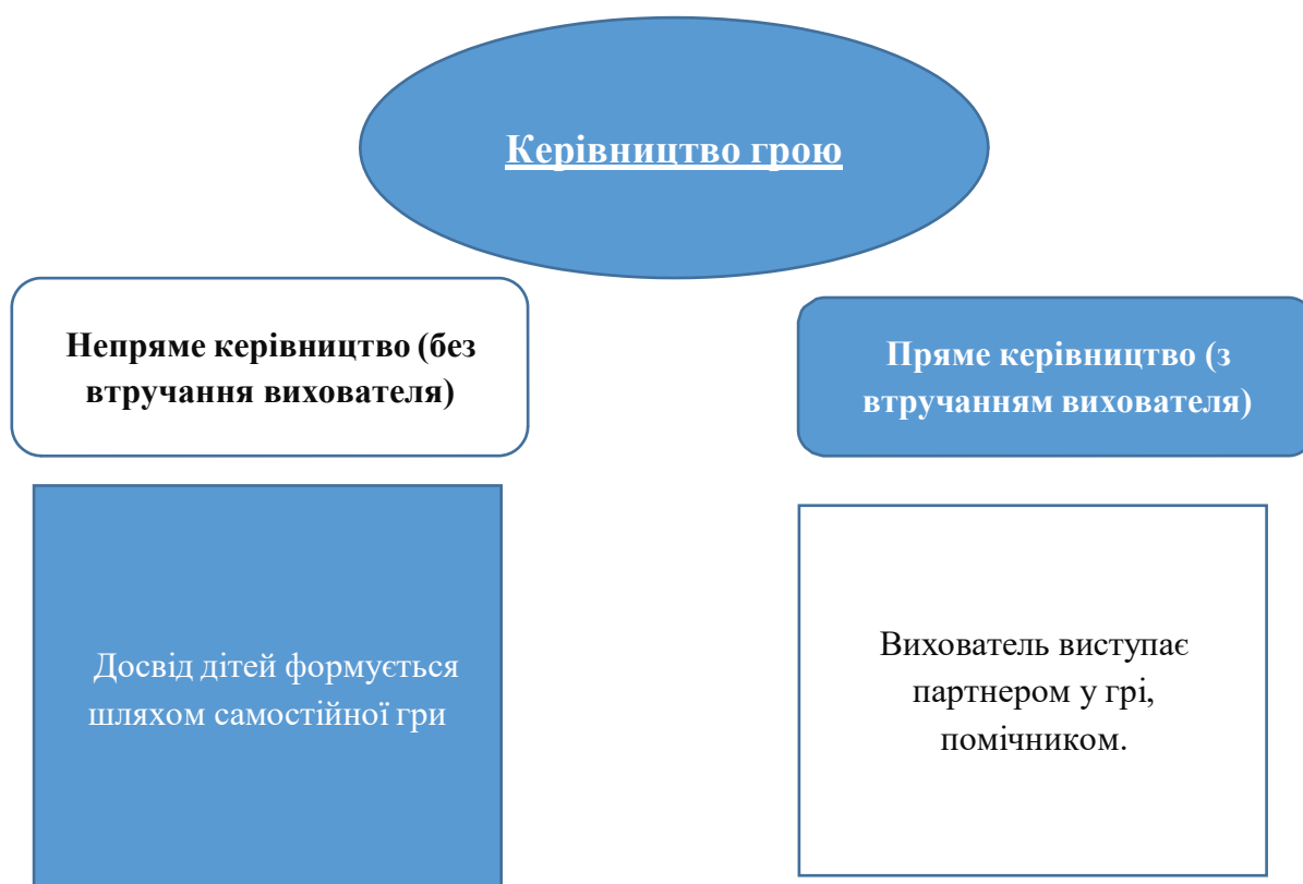
Рис. 1.2 Форми керування грою

Для першої молодшої групи (трьохрічних дітей) вихователям ставляться завдання щодо формування наступних вмінь та навичок в процесі сюжетно-рольових ігор: