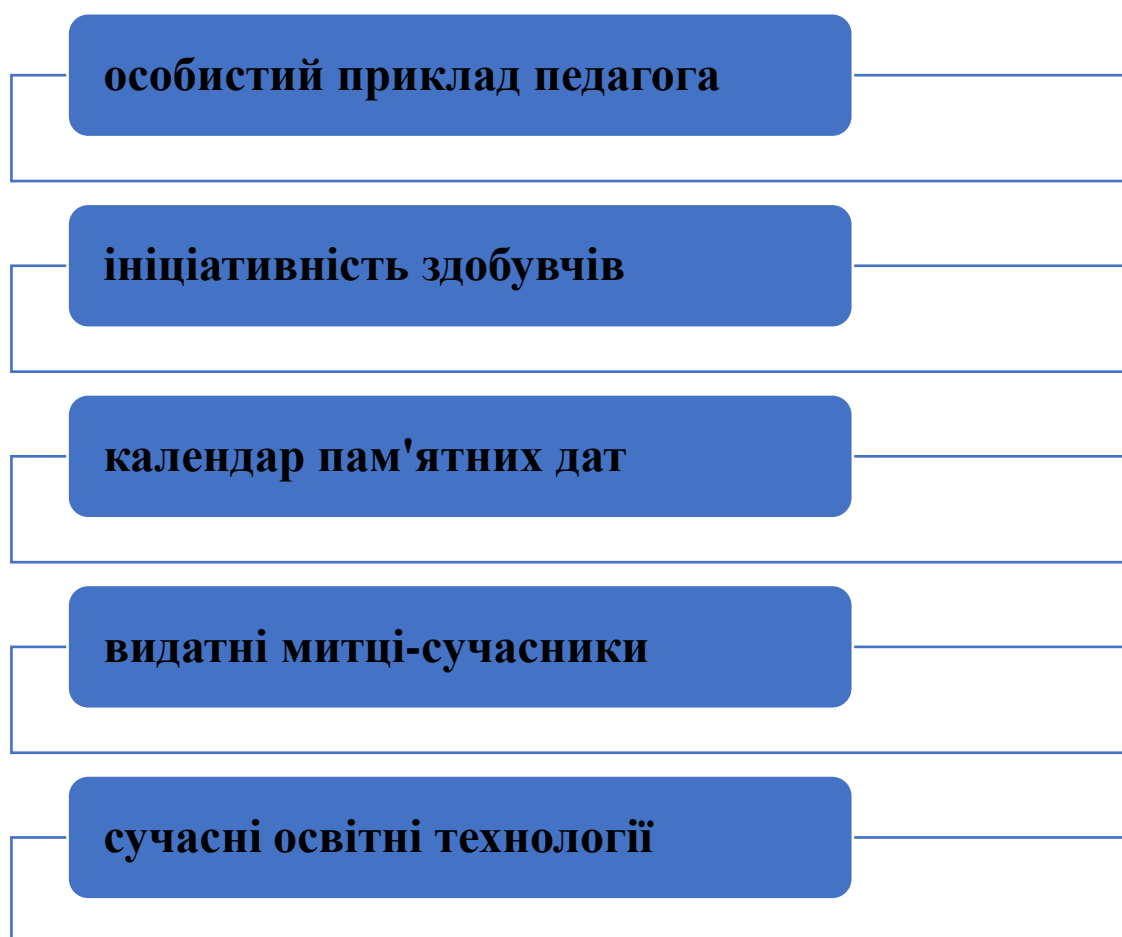
Рис. 3.2. Методичні рекомендації педагогічним працівникам з формування національно-патріотичної компетентності здобувачів освіти

Варто усвідомлювати, що формування національно-патріотичної компетентності здобувачів освіти має відбуватися не лише при вивченні курсу історії або на тематичних семінарах. Сьогодні існує безліч інноваційних освітніх технологій, зокрема із інтерактивом, за допомогою яких можна формувати та розвивати досліджуване явище. Тож, варто опанувати та постійно впроваджувати в практику викладацької діяльності, соціально-молодіжної роботи такі технології. Це дасть змогу викладачеві в цікавій формі викладати матеріал, організовувати різні заходи з формування національно-патріотичної компетентності учасників освітнього процесу.