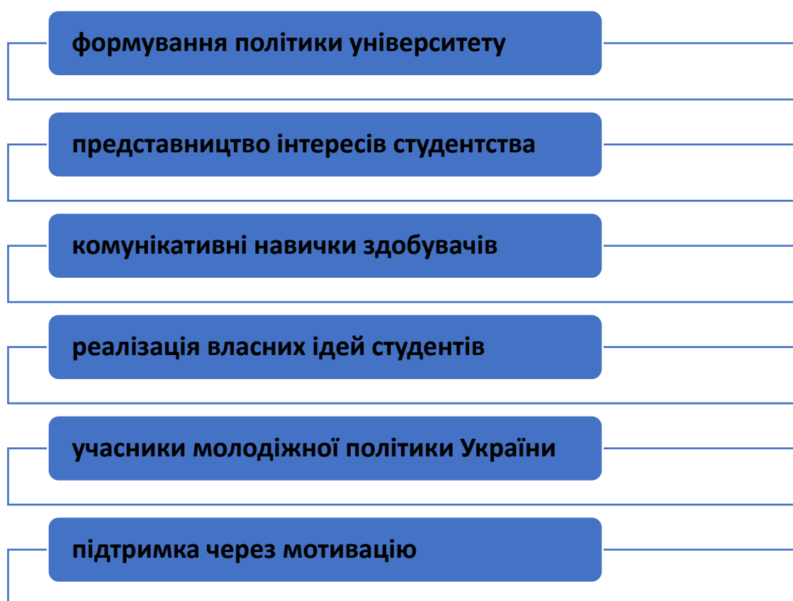
Рис. 3.1. Роль студентської ради закладу вищої освіти

Звісно, передбачити усі аспекти та можливості впливу студентської ради університету на формування загального світогляду здобувачів освіти неможливо, проте ми відмічаємо реальні можливості самої молоді бути патріотами своєї держави, показувати приклад іншим, заохочувати суспільство до національного руху за свободу, територіальну цілісність та незалежність України.