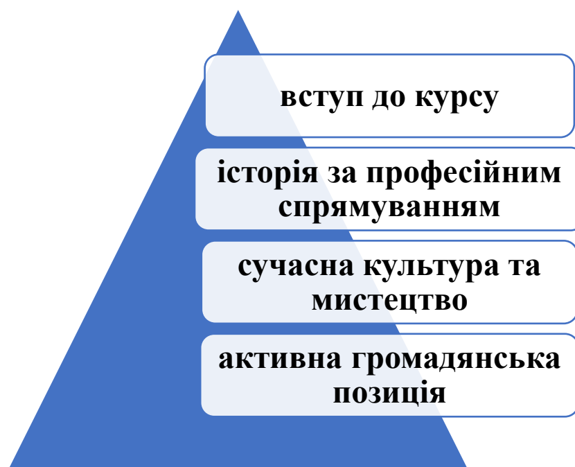
Рис. 2.2. Тематичний план модулю «Національно-патріотична компетентність особистості»

Ми розуміємо, що такий універсальний модуль може бути модифіковано до будь-якої спеціальності, рівня освіти та рівня сформованості національно-патріотичної компетентності слухачів. Тож, використання такого тематичного модулю може бути корисним як у вищій школі, так і інших закладах освіти, зокрема загальної середньої освіти, фахової передвищої, післядипломної, освіти дорослих.