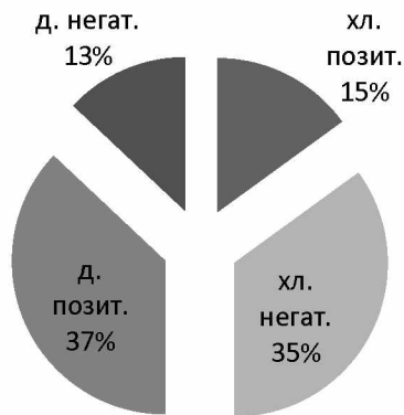
Рис.1 Знак емоцій

Для більшого унаочнення представимо дані таблиці у вигляді кругової діаграми.