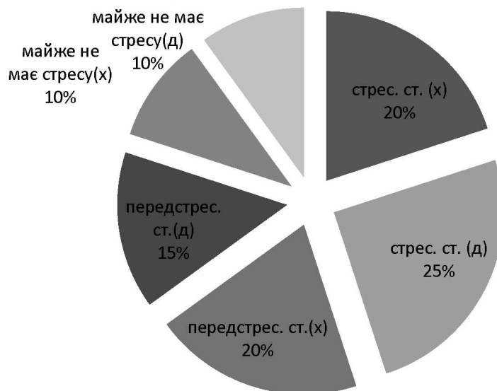
Рис.3 Наявність стресу

Щодо впливу емоцій на поведінку спостерігається незначне переважання у дівчат стимулюючого впливу (дівчата – 37%, хлопці – 30%) та незначне переважання у хлопців порівняно з дівчатами гальмівного впливу (20% - хлопці, 13% - дівчата).