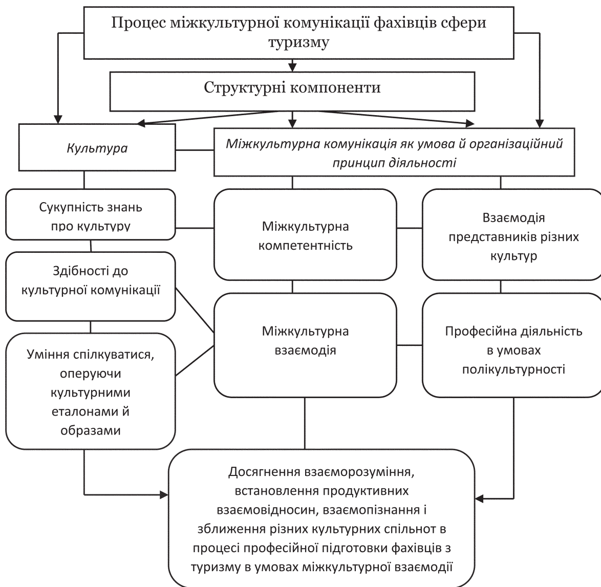
Рисунок 1 — Складові процесу міжкультурної комунікації фахівців сфери туризму

Як бачимо з рис. 1 процес міжкультурної комунікації фахівців сфери туризму має два взаємопов'язаних блоки. Перший — культура, як певна система знань, здібність до культурної комунікації та уміння спілкуватися, оперуючи культурними еталонами й образами. Другий блок — міжкультурна комунікація, яку ми трактуємо