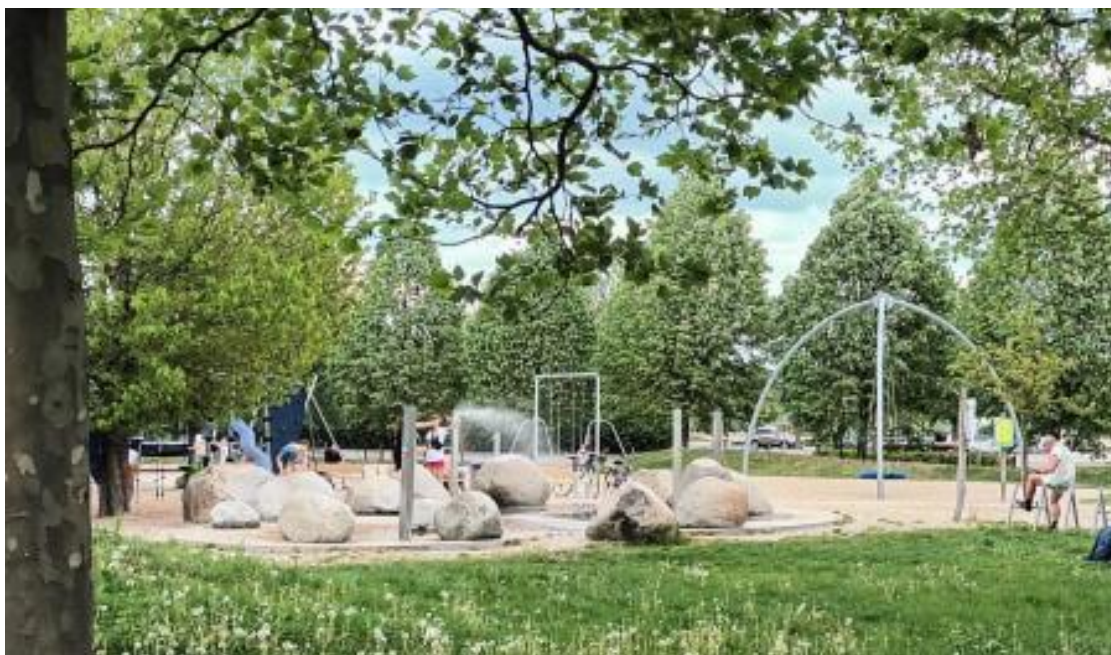
Рис. Б. 3. Парк Культури і Відпочинку