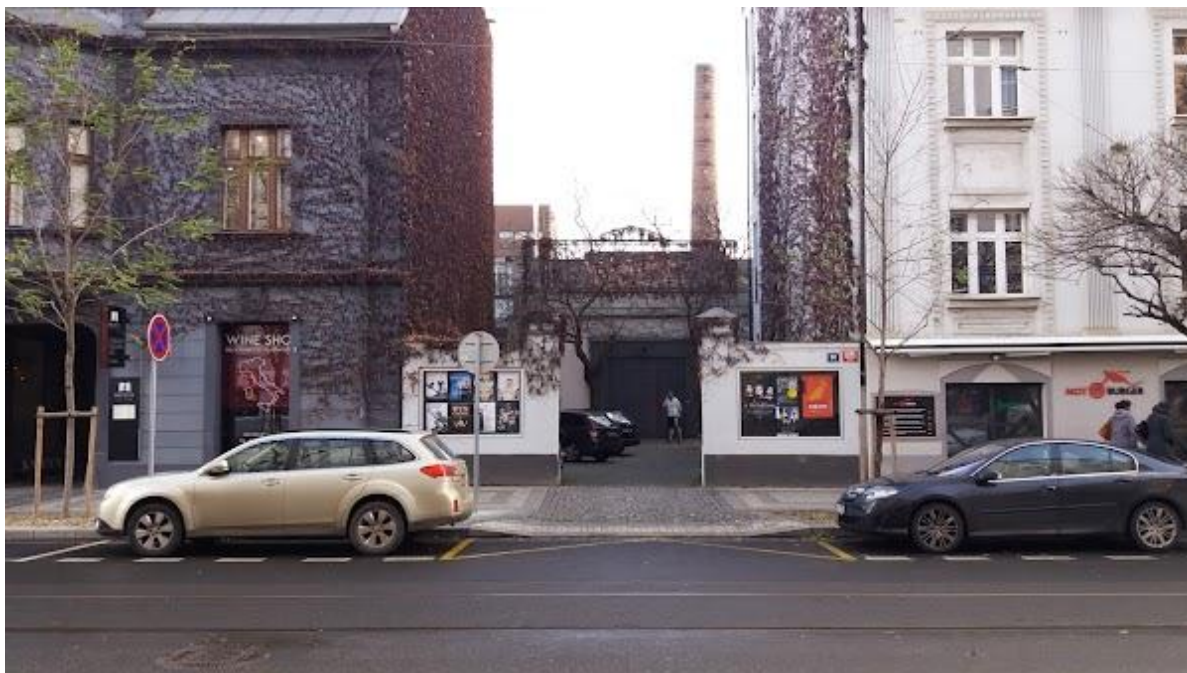
Рис. Б.1. Завод «Ла Фабрика»