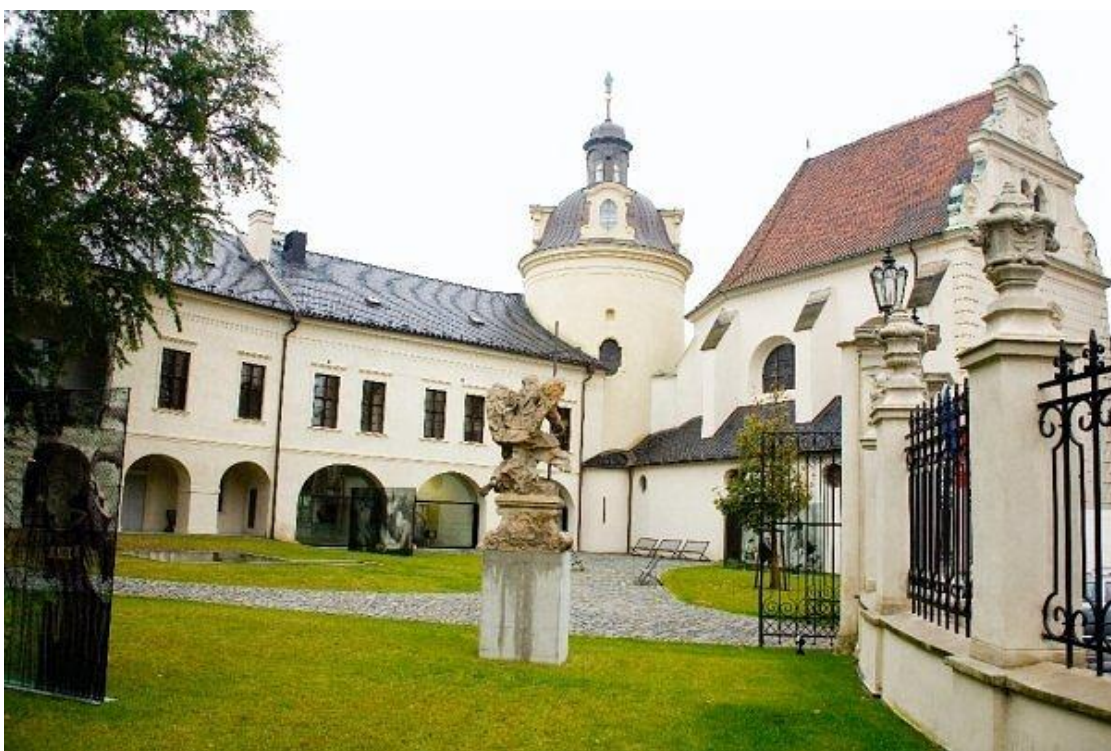
Рис. Б. 4. «Долина Млинів»