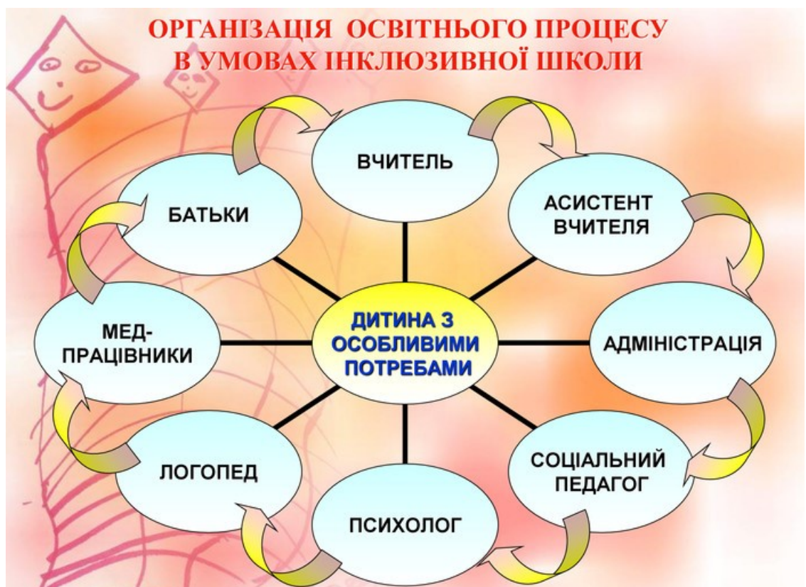
Рис. 1.1. Організація освітнього процесу в умовах інклюзивної школи

Про комплексний підхід до питання інклюзії яскраво свідчить забезпечення такого навчання безпосередньо в закладі загальної середньої освіти. Організацію освітнього процесу в умовах інклюзивного середовища закладу освіти представлено на рис.1.1.