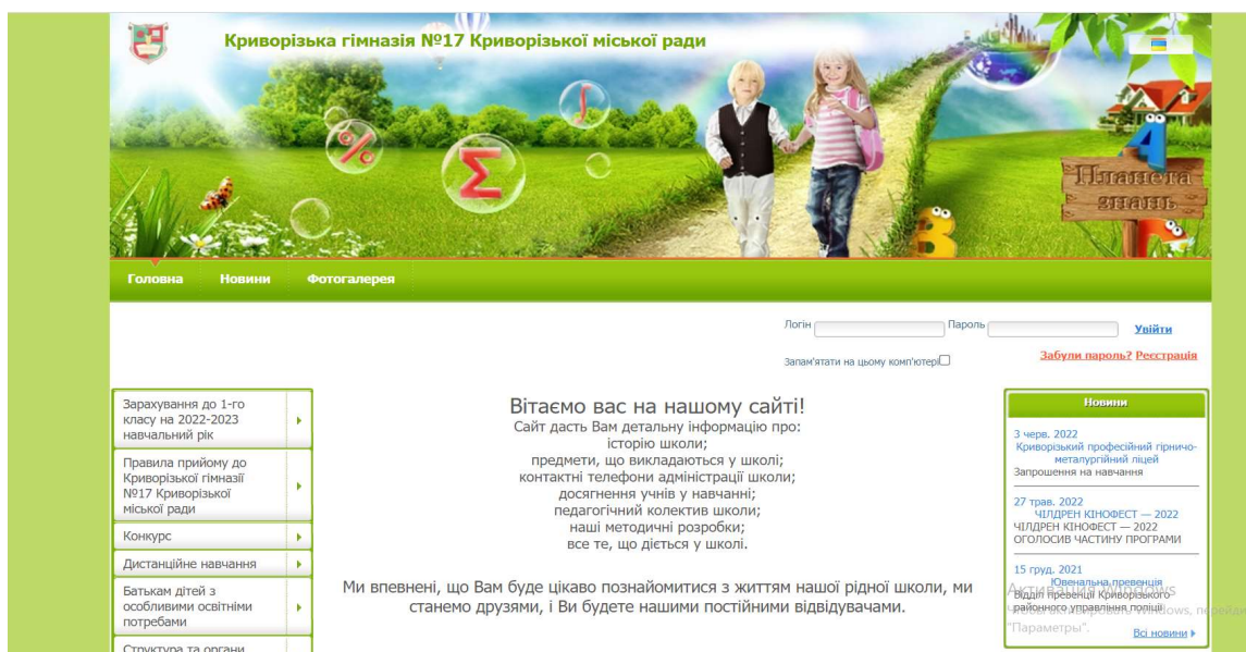
Рис. 2.1. Сайт Криворізької гімназії № 17