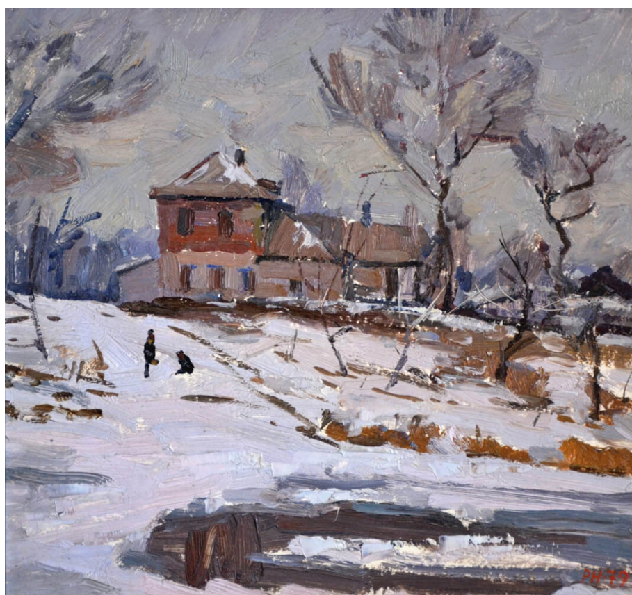
Микола Рябоконт «Криворізький дворик»