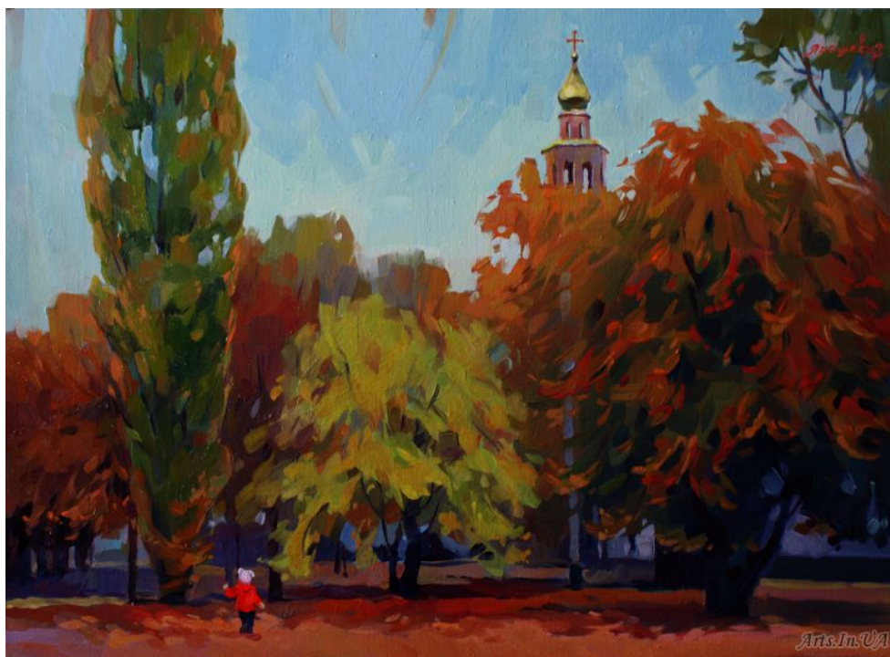
Анастасія Ярошевич «Осінь. Місто у вогні».