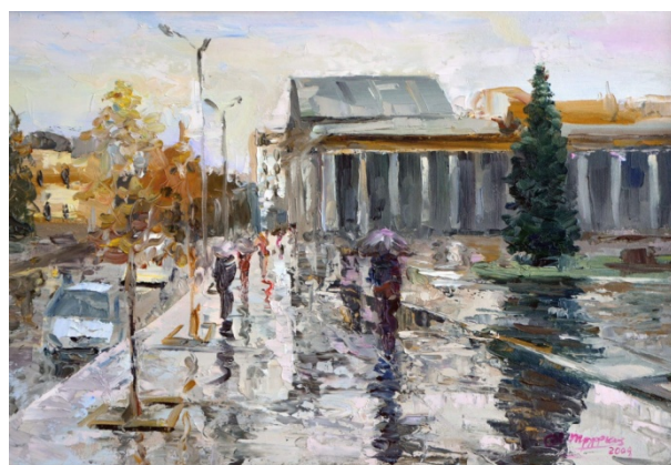
Труфкін А. Прогулянка під дощем