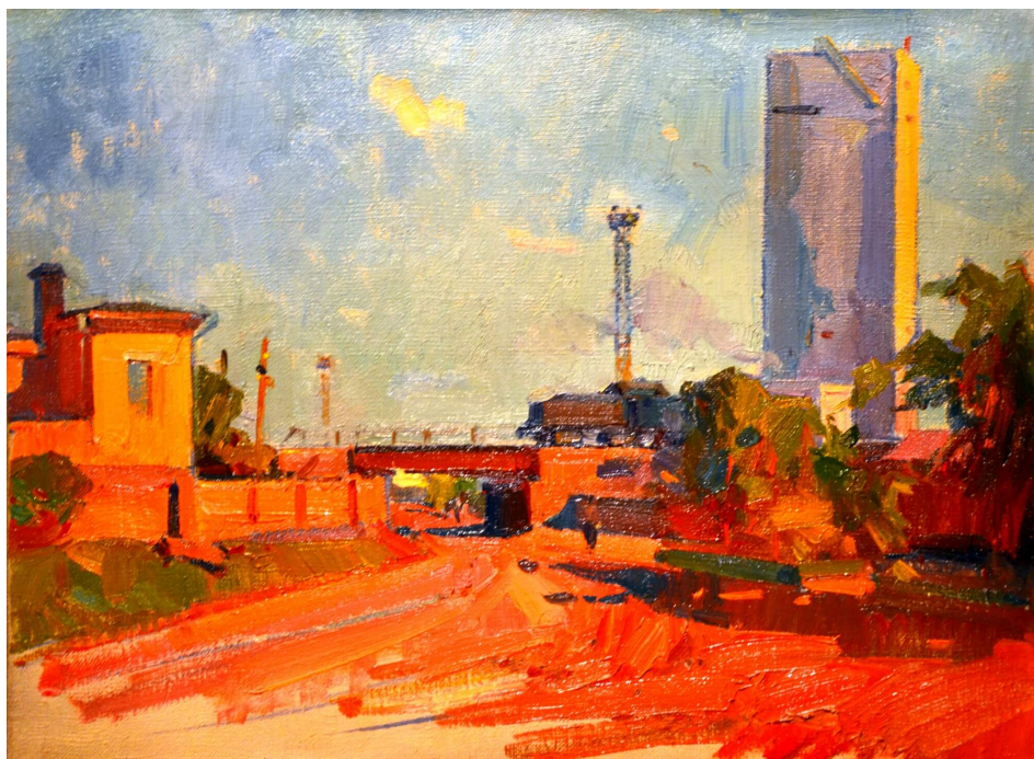
Григорій Шишко «Полудень спекотного дня»