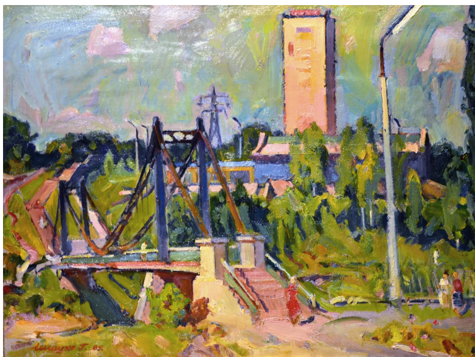
Григорій Шишко «Дорога на шахту Батьківщина»