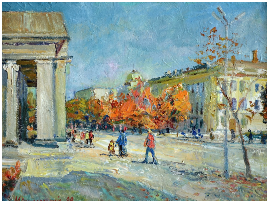
Віктор Мішуровський «Театр» Шевченка»