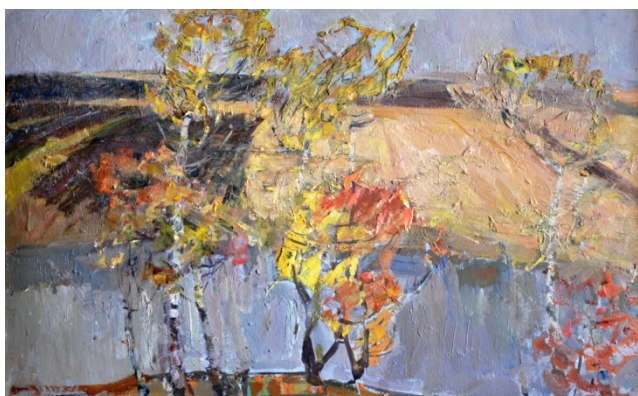
Белов В. Осінній день