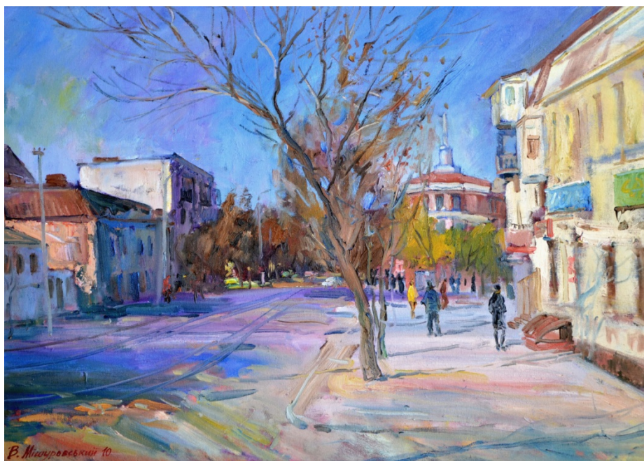
Віктор Мішуровський «Осінь на Криворіжжі»