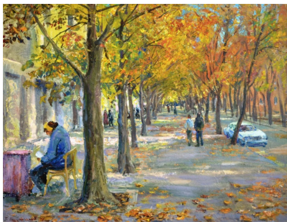
Мішуровський В. Вулиця Революційна