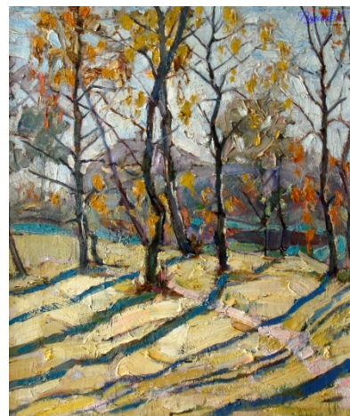
Синиця Г. Бабине літо