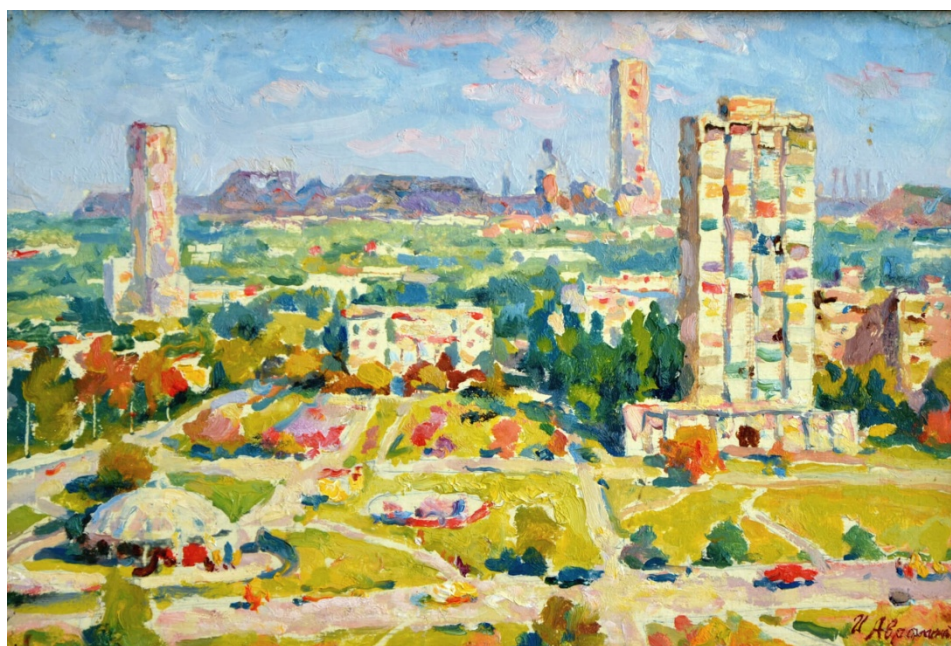
Іван Авраменко «Саксаганський район»