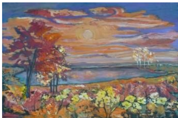
Козловська В. Осінь