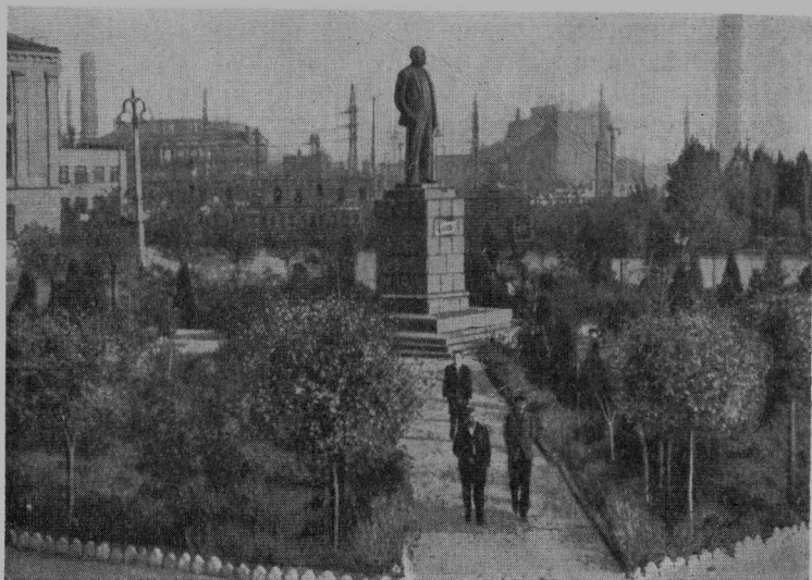
Біля входу до Новокриворізького гірничозбагачувального комбінату.

в криворізьких степах такі грандіозні споруди. Вічно золотом сяятимуть слова, вкарбовані в граніт: колони, що височить біля входу до Новокриворізького гірничозбагачувального комбінату: