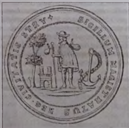
Печатка із зображенням купця. Стрий. XVII ст.

Щойно наведену систему творчих пізнавальних завдань доцільно використовувати у восьмому класі на уроці, присвяченому господарському життю і політичному устрою Гетьманщини у другій половині XVII ст. Найбільш ефективною вона виявляється під час вивчення розвитку ремесел, промислів та торгівлі. Його засвоєння вимагає від восьмикласників досить високого рівня абстрактного мислення. Однак, дуже часто школярі уявляють собі ринок як величезний ярмарок, куди з'їжджаються покупці та продавці з усієї України. В даному випадку поняття «ринок» засвоюється на суто емпіричному рівні, тобто на рівні повсякденного життєвого досвіду або чуттєвого сприйняття. Науковий же рівень опрацювання такого поняття передбачає поєднання цього уявлення і перехід на зовсім інший рівень мислення. Саме цьому і підпорядкована наведена вище система пізнавальних завдань.