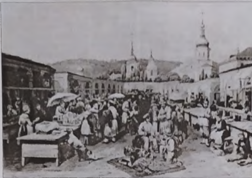
Ярмарок на Подолі у Києві.

Розв'язуючи перше з них, восьмикласники відзначають, що рівень розвитку торгівлі в Україні у XIII — першій половині XIV ст. був порівняно невисоким. Про це свідчить те, що ринки та базари працювали тільки у великих містах і тільки один раз на тиждень. А у XV ст. вони почали працювати вже два-три дні на тиждень. А це значить, що торгівельні зв'язки істотно поглибилися. У XVI ст. торгівельні зв'язки стали настільки міцними, що ринки й базари працювали навіть у великих селах. Саме тут вчителю доцільно поставити учням додаткове запитання про причини поступового поглиблення торгівельних зв'язків в Україні протягом XIV-XVI ст. Після нетривалої дискусії восьмикласники доходять висновку, що таких причин дві. По-перше, внаслідок покращення знання праці підвищилася її продуктивність і, як результат, виросла кількість надлишкового продукту, яким можна було торгувати. По-друге, відбувся подальший поділ праці, і це привело до істотного розвитку торгівлі. Закріплен-