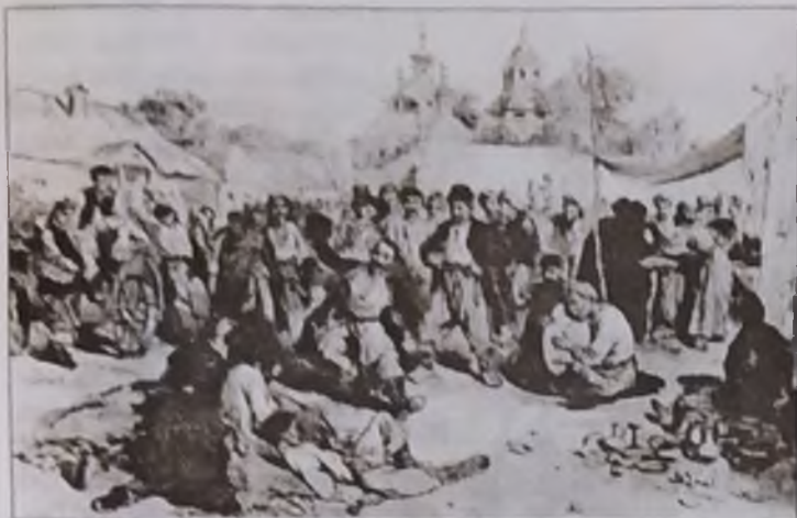
Ярмарок. Малюнок Т. Трутовського.

попитом та пропозицією стосовно того чи іншого товару». В цей спосіб закладаються основи усвідомлення в старших класах такого визначення цін, як грошової форми вартості товару. Крім того, такий підхід сприяв більш ефективному засвоєнню старшокласниками закону вартості як основного закону ринкової економіки. Суть же цього закону полягає в тому, що ціни, як грошова форма вартості товару, повинні коливатися навколо його економічного змісту, яким є вартість самого товару.