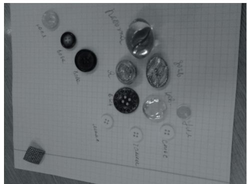
Предметна модель «Події мого життя»