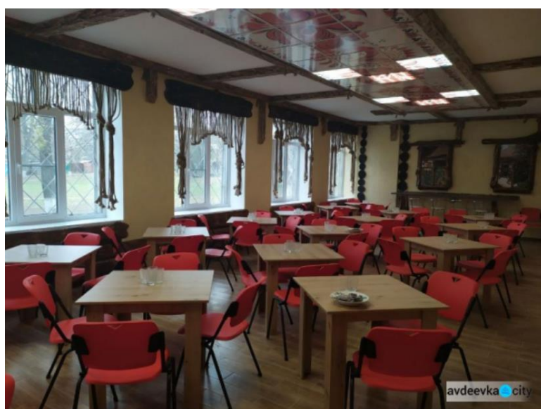
Рис. 1.2 Приклади інтер'єрів з використанням етнічних акцентів.