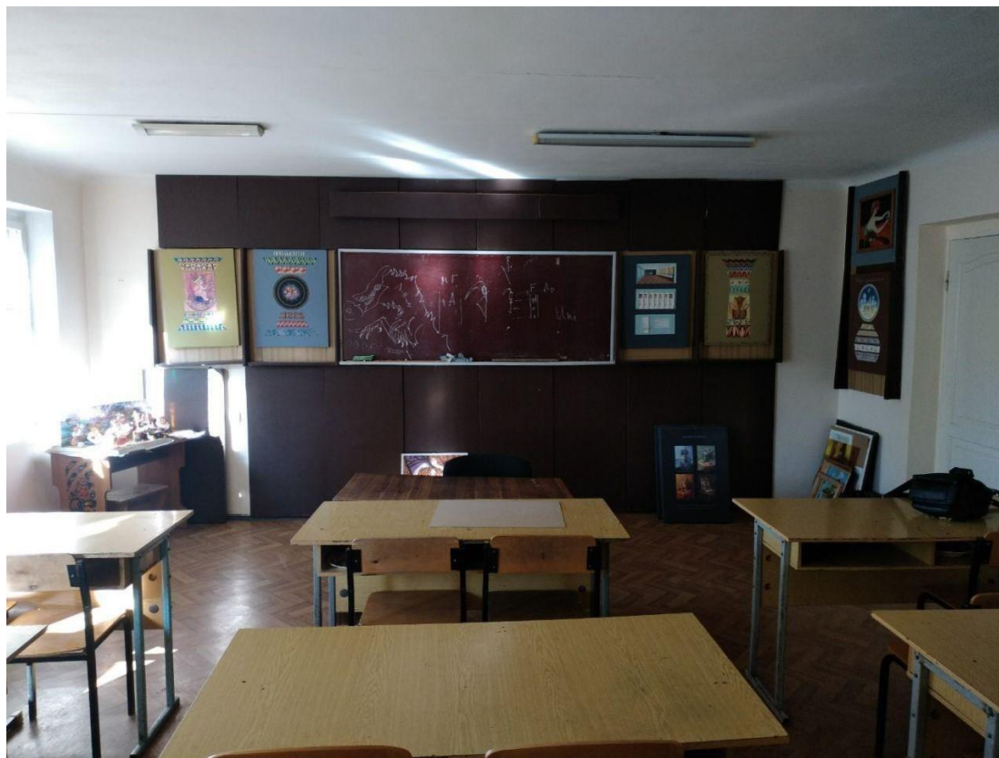
Рис. 2.1 Існуюча ситуація.