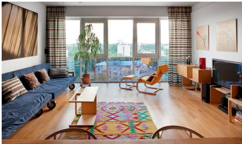
Рис. 1.1 Приклади інтер'єрів в декоративному стилі