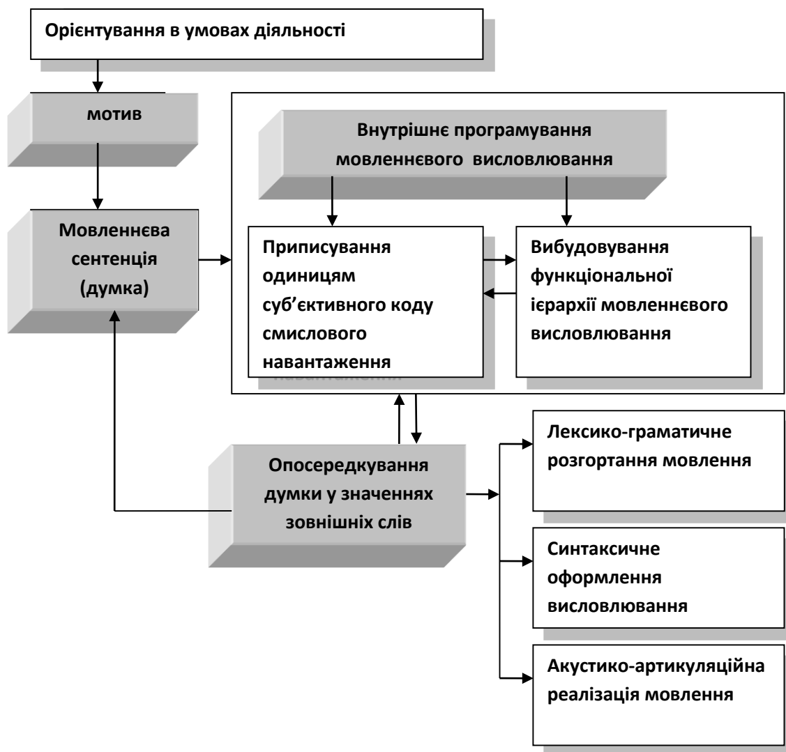
Рис.2. - Модель породження мовлення (за О.О.Леонт'євим)

Більш структуровано інтерпретує процес породження мовлення як послідовність взаємопов'язаних фаз діяльності О.О.Леонт'єв [4; 5], модель якого (рис.2.) створена на підставі фундаментального аналізу концептуальних положень теорії мовленнєвої діяльності Л.С.Виготського та теорії діяльності О.М.Леонт'єва.