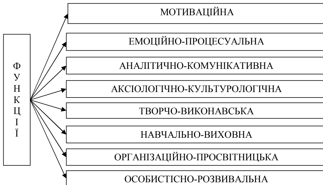
Рис. 1. Структура функцій вокально-педагогічної діяльності вчителя музичного мистецтва.

компонентами структури функцій його вокально-педагогічної діяльності: мотиваційної; емоційно-процесуальної; аналітично-комунікативної; аксіологічно-культурологічної; творчо-виконавської; навчально-виховної; організаційно-просвітницької; особистісно-розвивальної (рис. 1).