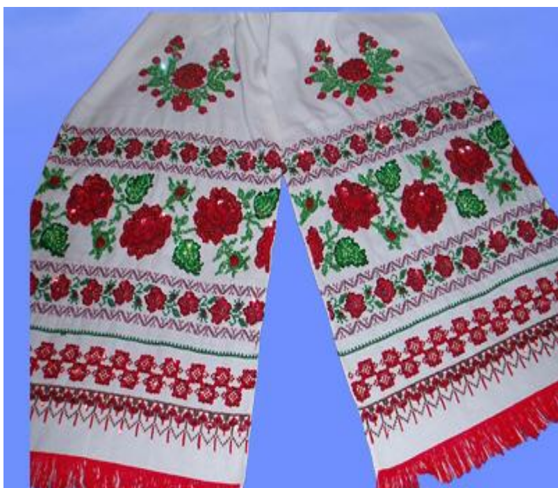
Рис. 3.1. Традиційний український рушник

лозоплетіння та соломоплетіння, гончарство, кераміку, художню обробку металу, вироби з паперу тощо. Розповімо детальніше про деякі з них. Цікавий і самобутній вид національного мистецтва — набійка (вибійка, вибиванка, ма-льованка, друкованиця, димка). Це тканина з нанесеним вручну візерунком. Спершу вирізали на дощці плоский орнамент, змащували фарбою і набивали на полотно. Так оздоблювали предмети хатнього побуту (скатертини, рушники, постільну білизну) та одяг. У сучасному інтер'єрі набійку застосовують на текстильних шпалерах, постільній білизні, скатертинах, рушниках [62, с.89].