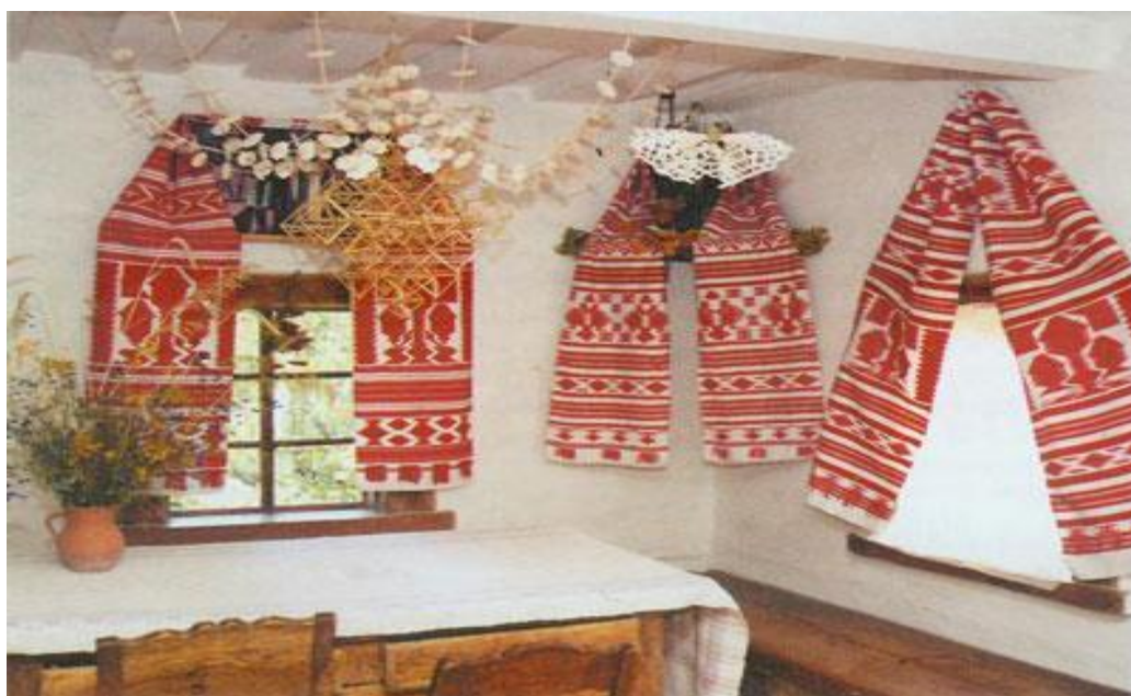
Рис. 3.2. Приклад оздоблення власної оселі українськими рушниками

Українську світлицю неможливо уявити без вишитих і тканих рушників . Їх вивішують над іконами та портретами родичів, ними прикрашають вікна, стіни, двері. Адже смуга полотна має символічне значення — дороги, щасливої долі. А коли на ній виткані чи вишиті знаки-обереги, захисна сила її суттєво посилюється [62, с. 91].