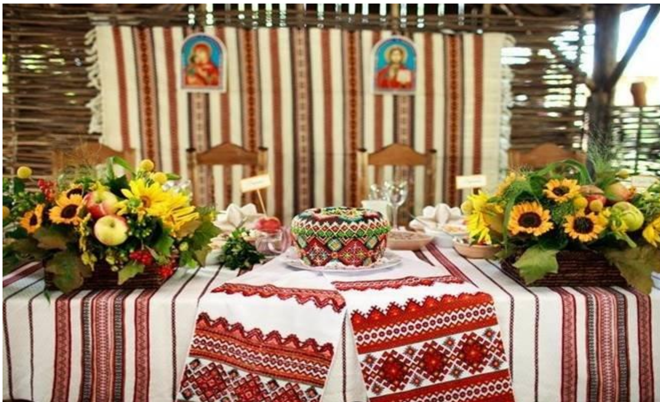
Рис. 2.1. Вишиті українські рушники завжди містять знаки-обереги

Так, власникам хати, що оздоблена такими українськими рушниками, була гарантована щаслива доля для усієї родини. А коли на ньому виткані чи вишиті знаки-обереги, захисна сила українського рушника суттєво посилюється.