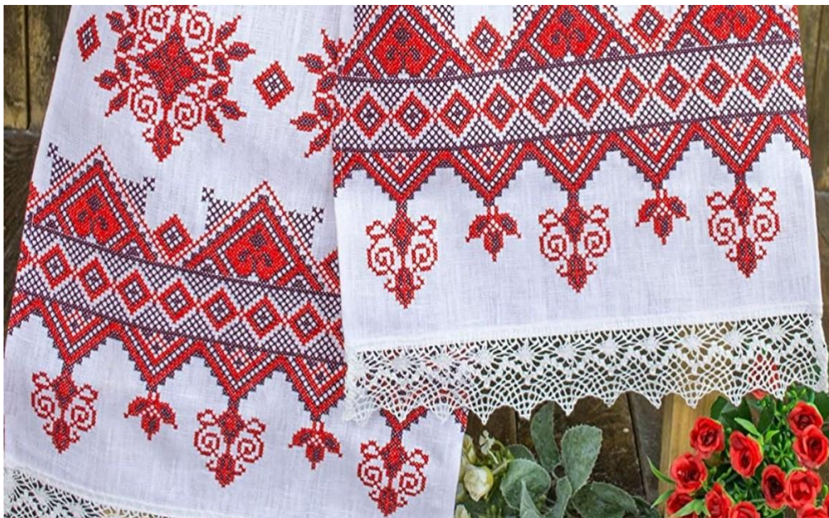
Рис. 2.2. Традиційний український рушник

Зазвичай, кольорова гама кухні — це колір дерева і глини, білий, червоний, чорний, зелений, синій та жовтий. Стіни кухні білі, світло-бежеві або голубуваті. Їх іноді розписують рослинними мотивами чи геометричними орнаментами. У стінах роблять ніші, які заповнюють декоративними елементами. Світильники також можна декорувати орнаментом. Особлива увага приділялася умеблюванню. Головним атрибутом кухні є стіл. Його завжди найретельніше доглядали і прикрашали на свята, його цілували перед далекою дорогою і після повернення додому. Стіл накривають вишитою скатертиною (обрусом) або українським рушником [62, с. 91].