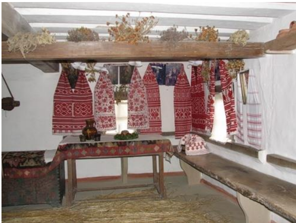
Рис. 3.3. Оздоблення помешкання українськими рушниками

V. Закріплення нового матеріалу. Обговорення з учнями вищевикладеного навчального матеріалу, обмін думками та враженнями після перегляду навчального фільму та майстер-класу. Підготовка до практичної роботи.