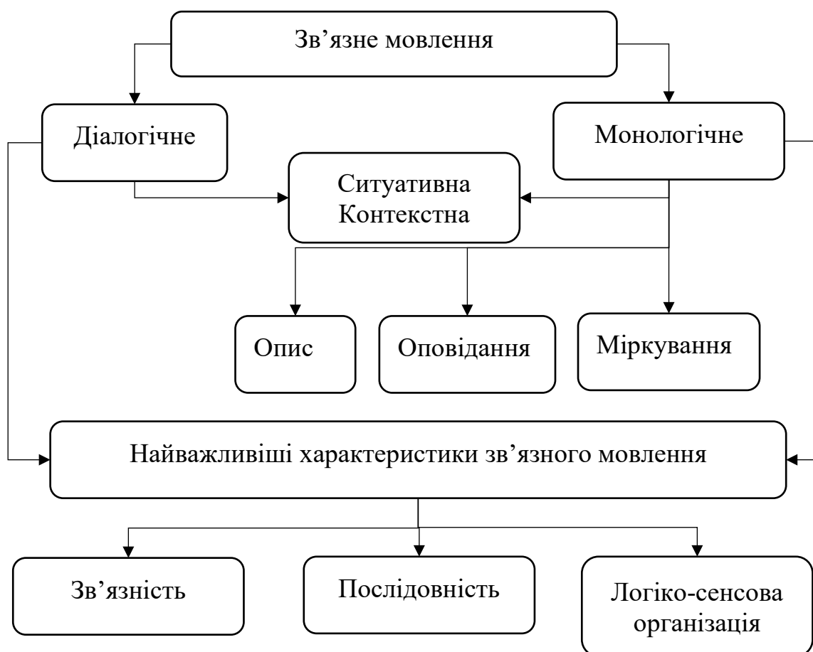
Рисунок 1.1. Характеристика зв'язного мовлення

У результаті вивчення психолого-педагогічної літератури, характеристику зв'язного мовлення можна представити у вигляді такої моделі (рис. 1.1.).