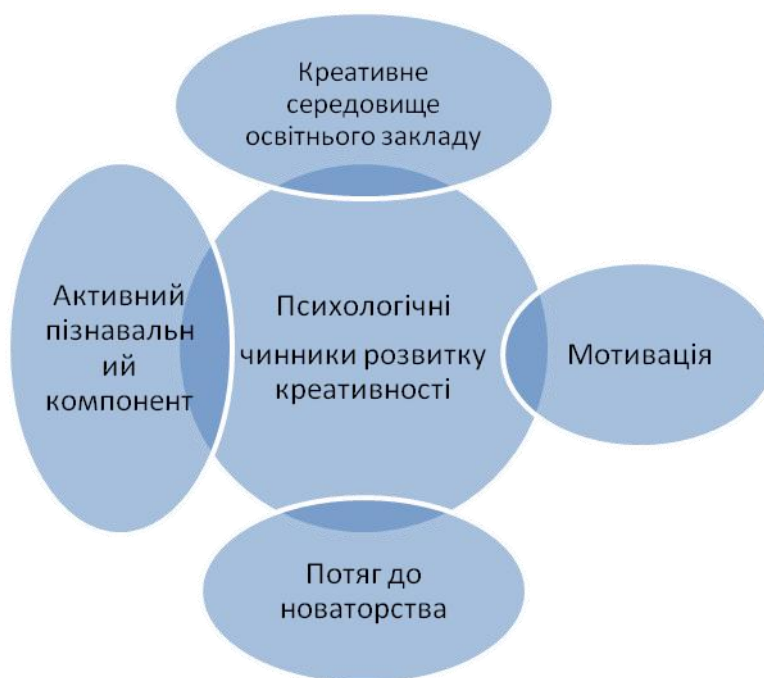
Рис.1.2.1. Психологічні засади формування креативності практичного психолога.

В узагальненому вигляді на основі опрацьованих наукових джерел, основними засадами формування креативності можна вважати наступні (дивись рис.1.2.1.)