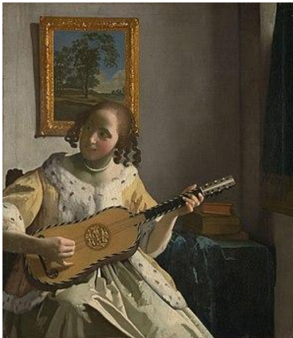
Я. Вермеєр. Гітаристка