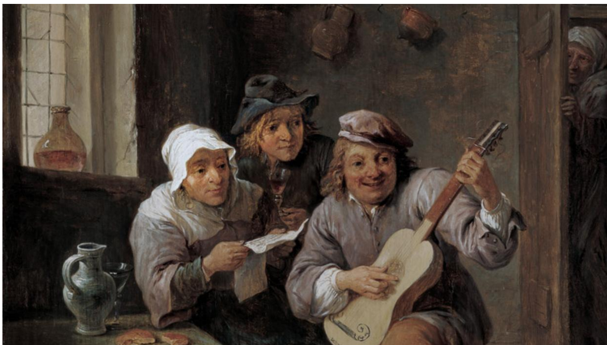
Давид І Тенірс. Селяни, що музикують