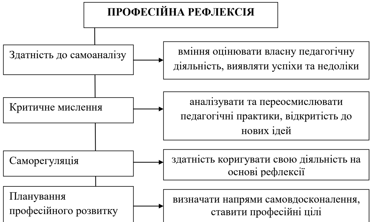
Рис. 1.7. Складники професійної рефлексії

Розвиток професійної рефлексії сприяє глибшому розумінню педагогічної діяльності, підвищує ефективність навчально-виховного процесу та сприяє професійному зростанню вчителя. Майбутній педагог, який володіє навичками рефлексії, здатен критично оцінювати свою роботу, адаптуватися до змінних умов освіти та постійно вдосконалюватися, що є необхідним для успішної професійної діяльності.