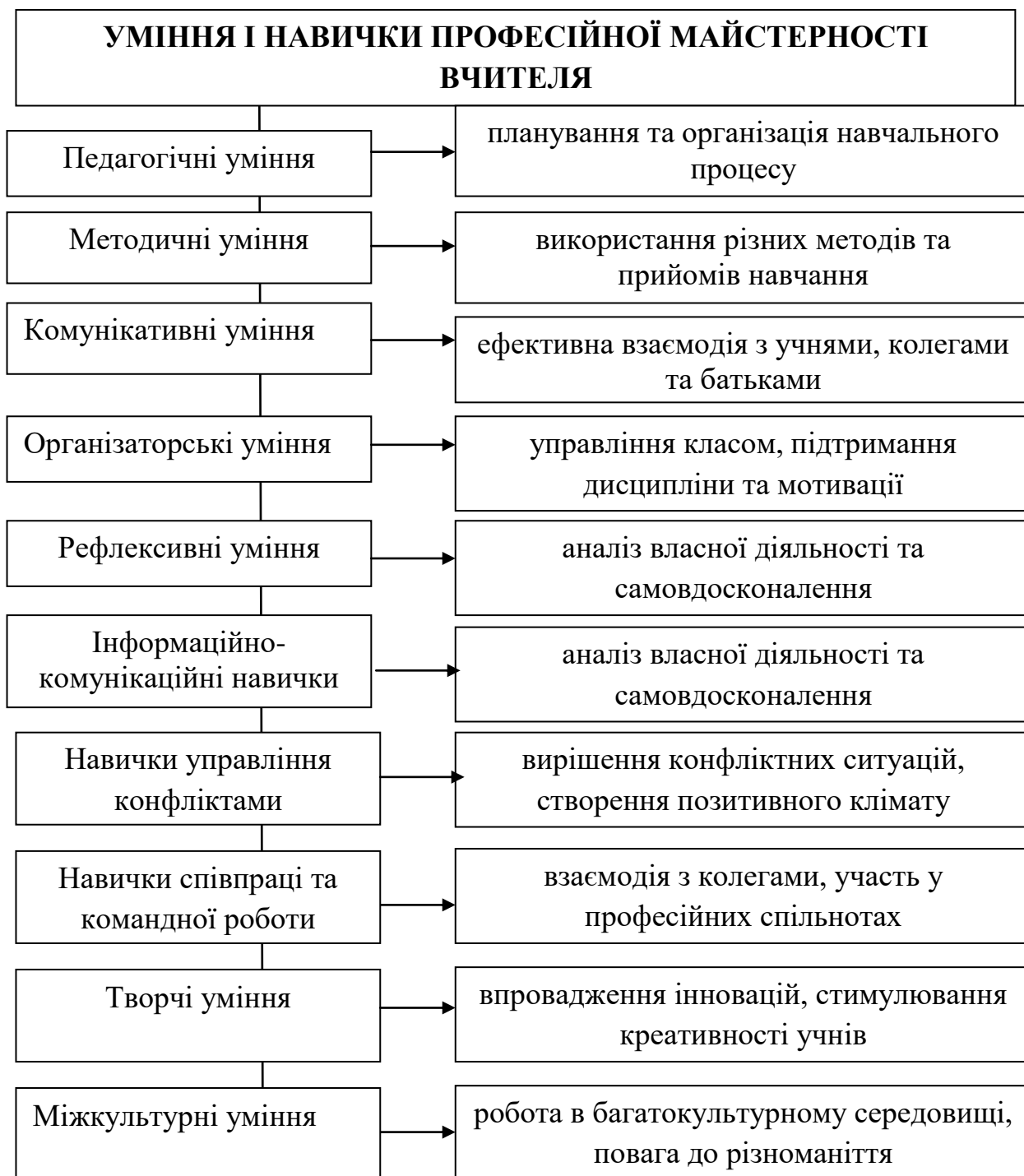
Рис. 1.4. Уміння і навички як складники професійної майстерності вчителя

Отже, уміння та навички, необхідні для формування професійної майстерності майбутнього вчителя, включають низку компонентів, які унаочнено на Рис.1.4.