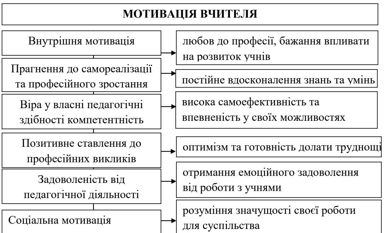
Рис. 1.6. Мотивація як складник професійної майстерності вчителя

Отже, до наповненості структурного компоненту «мотивації» відносимо низку показників, які узагальнюємо на Рис. 1.6.