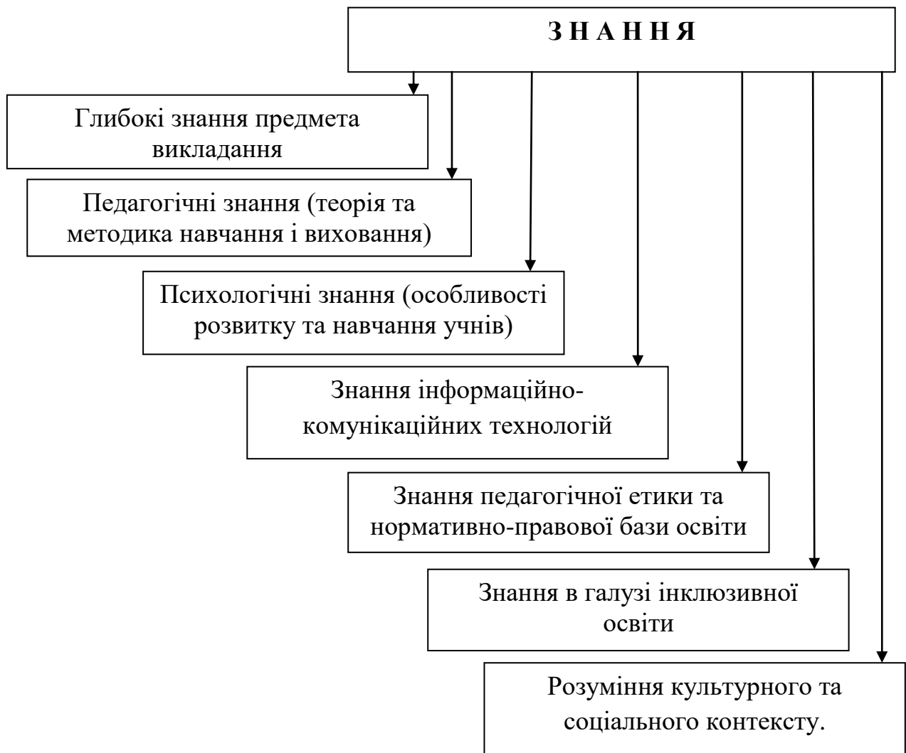
Рис.1.3. Структура знань майбутнього вчителя.

Представлені у схемі знання забезпечують майбутньому вчителю міцну основу для формування професійної майстерності, дозволяючи ефективно планувати та здійснювати освітній процес. Вони сприяють здатності вчителя відповідати на виклики сучасності, адаптуватися до швидких змін у суспільстві та сприяти всебічному розвитку учнів. Завдяки комплексному підходу до формування знань майбутній вчитель стає компетентним професіоналом, готовим до інновацій та постійного самовдосконалення.