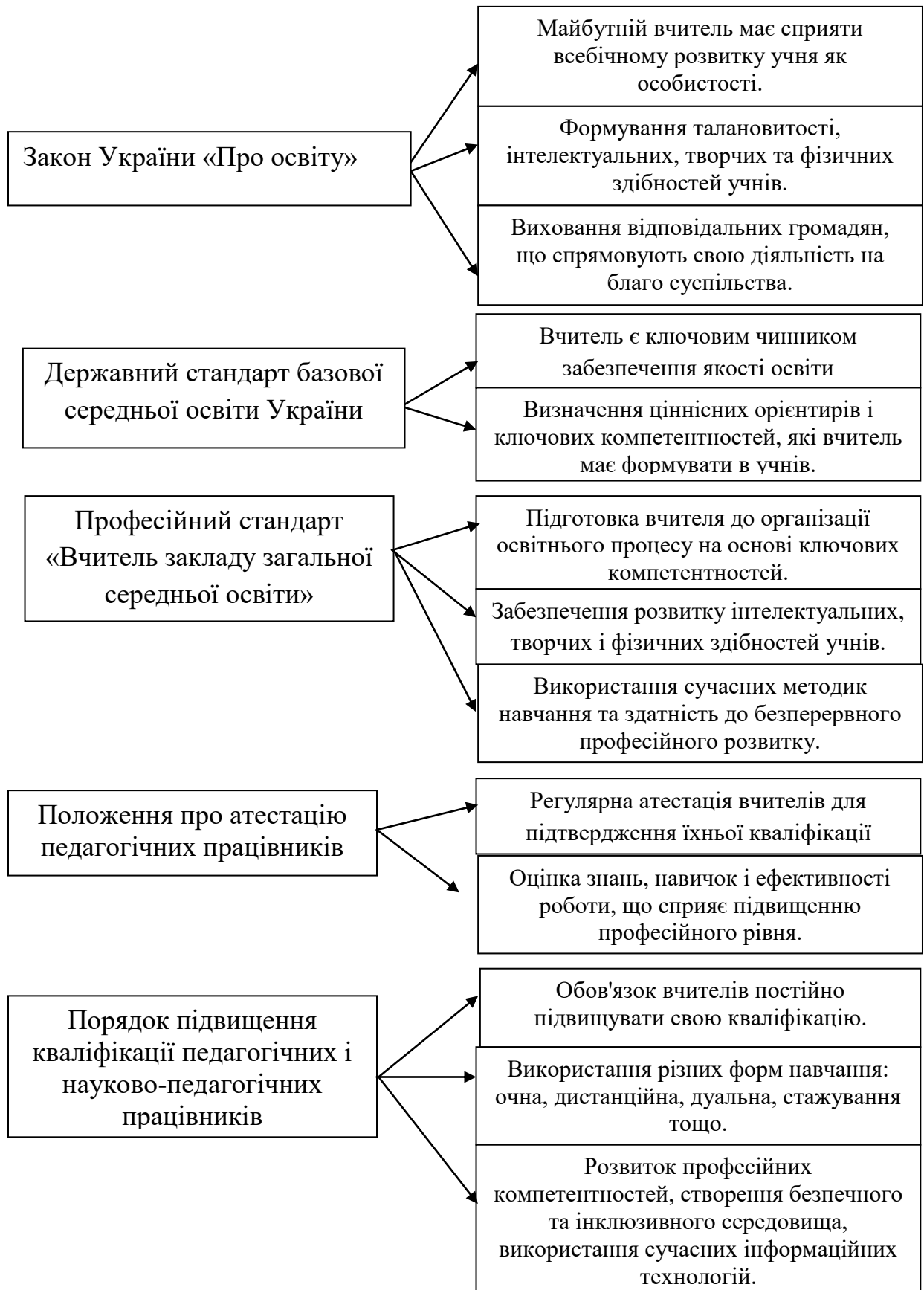
Рис. 1.1. Вимоги до професіоналізму вчителя відповідно до нормативних документів