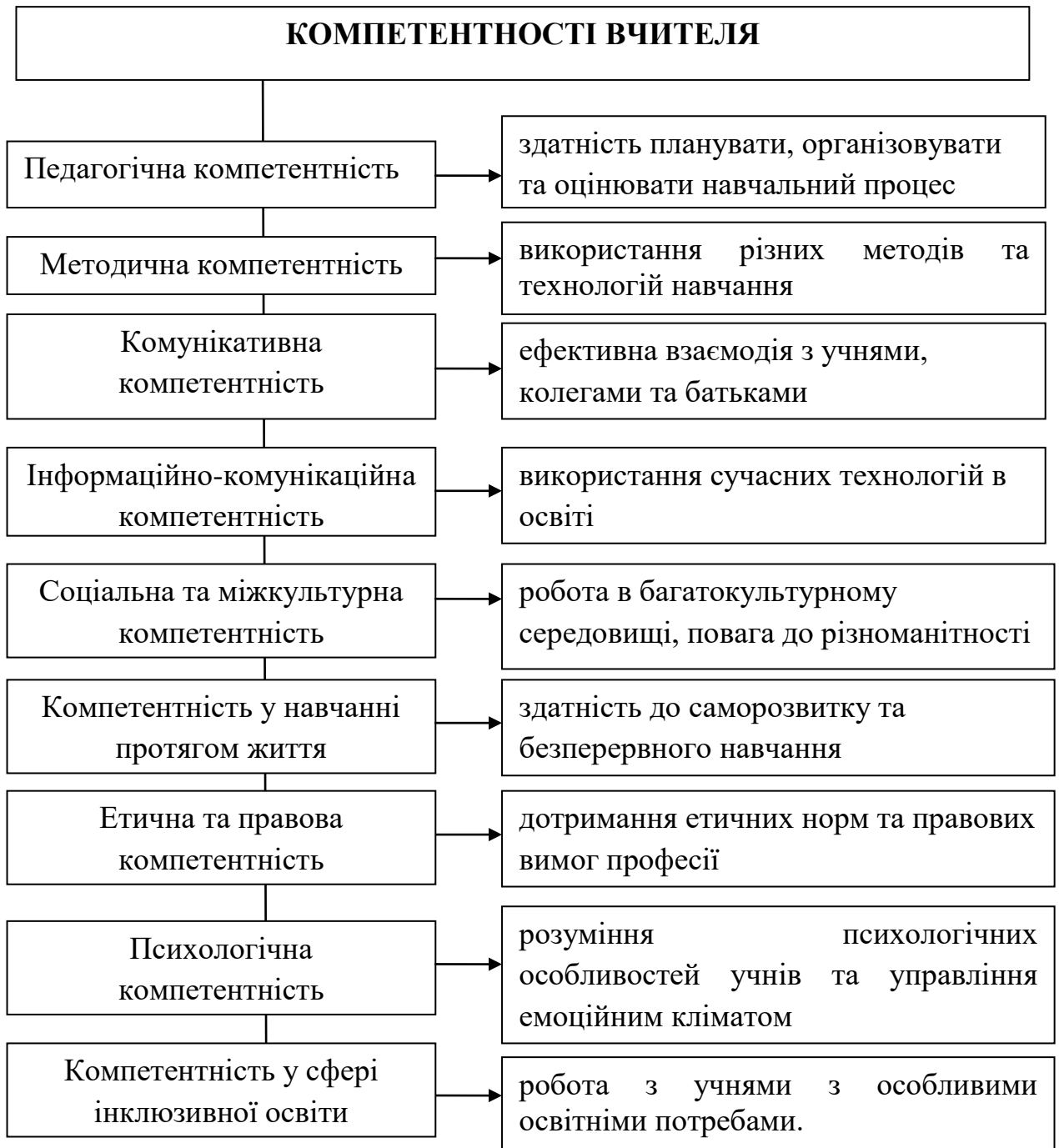
Рис. 1.5. Компетентності як складник професійної майстерності вчителя

необхідні для успішної педагогічної діяльності. Таким чином, компонент компетентність у структурі професійної майстерності майбутнього вчителя повинен включати низку компонентів, які ми унаочнили на Рис. 1.5.