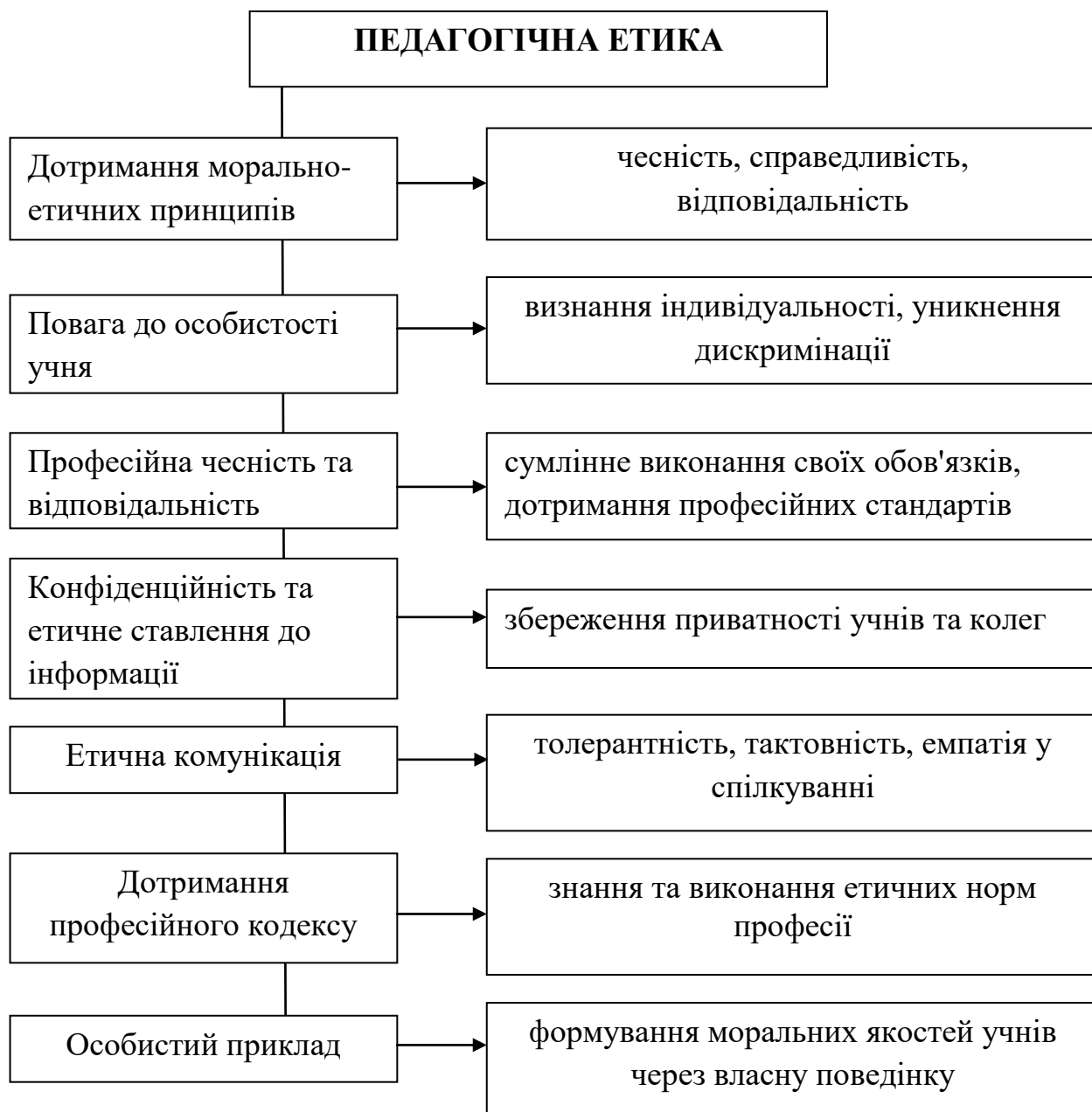
Рис. 1.8. Складники педагогічної етики

Таким чином, структурні компоненти професійної майстерності вчителя – знання, уміння, навички, компетентності, мотивація, професійна рефлексія, педагогічна етика – є взаємопов'язаними елементами, які забезпечують ефективність педагогічної діяльності.