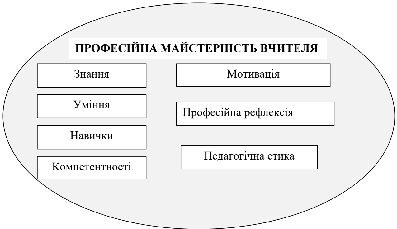
Рис.1.9. Професійна майстерність вчителя за сучасними педагогічними дослідженнями

Об'єднання означених на Рис.1.9. компонентів передбачає ефективну професійну підготовку, особистісний розвиток та постійне самовдосконалення вчителя. Такий підхід дозволяє майбутньому педагогу відповідати вимогам сучасної освіти, сприяти всебічному розвитку учнів та ефективно адаптуватися до швидких змін у суспільстві.