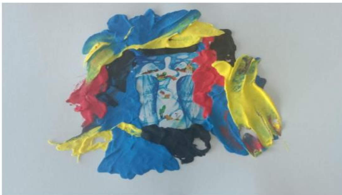
Рис. 1.1. Арт-терапевтичні завдання проєкту.