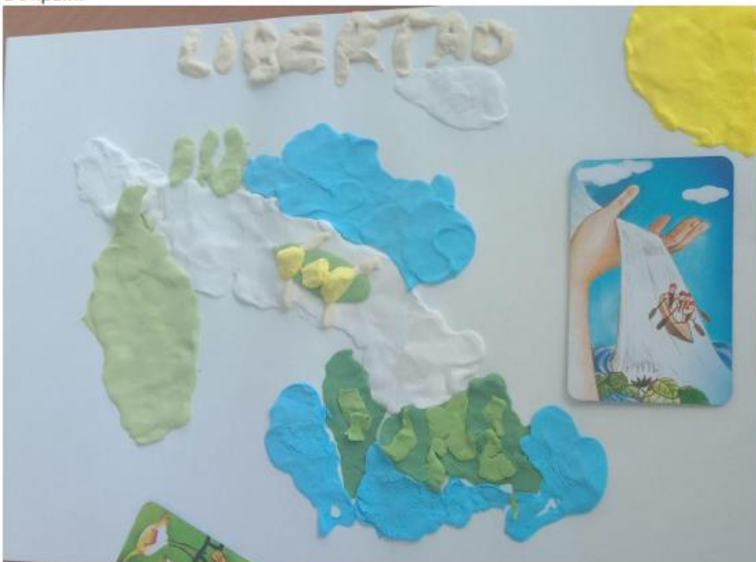
Фото 4 Ігор, військовий лікар: «Таке воно, наше життя»