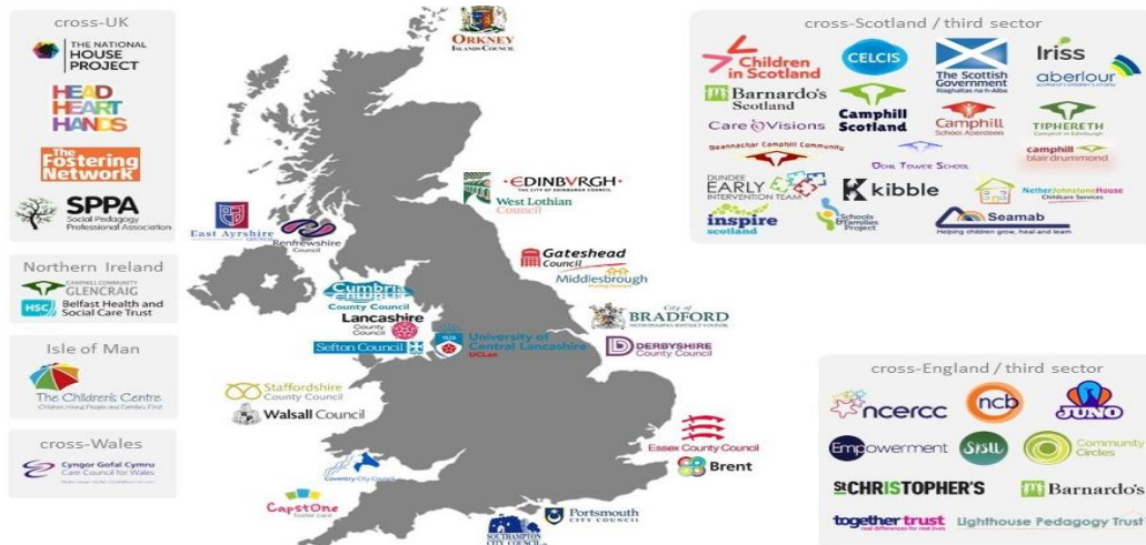
Рис 2.7., Рис. 2.8. Проекти освіти та навчання.

We started off in 2007, when we designed and facilitated the first Social Pedagogy course in the UK as part of a pilot project run by the National Centre for Excellence in Residential Child Care. Since then, we have worked with The Fostering Network on Head, Heart, Hands , an exciting demonstration programme introducing Social Pedagogy to foster care, and were involved in innovative, systemic strategies to implement Social Pedagogy across a wide range of services across the UK (see image below). We have also been collaborating with the University of Central Lancashire on co-delivering the MA Social Pedagogy Leadership.