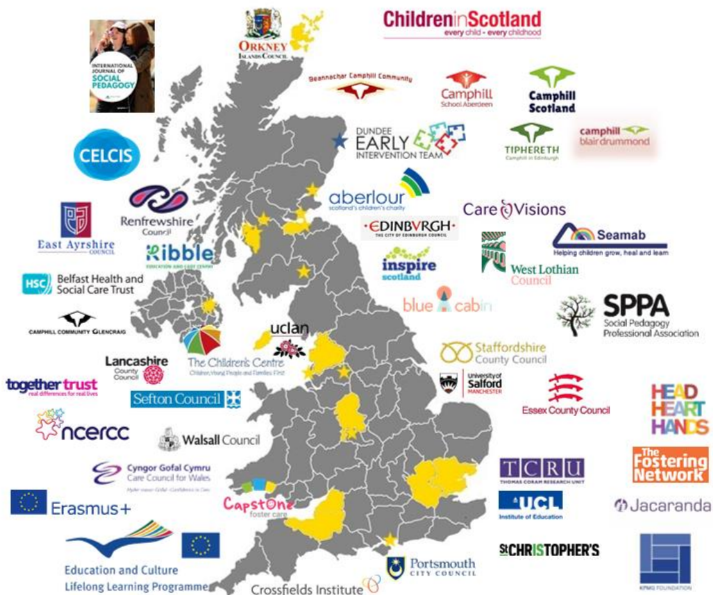
Рис 2.9. Проекти методологічної підтримки.

Сприяння ком'юніті – підтримка мережі Social Pedagogy Development Network для обміну досвідом. Повноцінне використання діджиталізації та потужного впливу соціальних джерел дозволяє шукати та заохочувати все більше спеціалістів до створення та участі у проєктній діяльності, залучати спонсорів, пропагувати та проводити просвітницьку діяльність про результати своєї роботи та її актуальність.