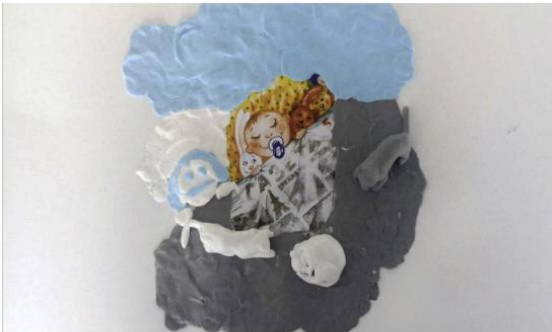
Фото 2. Володимир мріє про рибалку після одужання