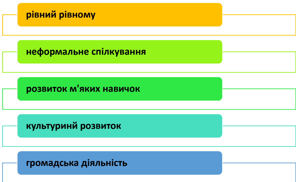
Рис. 3.2. Методичні рекомендації педагогам

У закладах освіти сьогодні є безліч можливостей для залучення студентів до громадської діяльності. Перш за все, це волонтерство. Волонтерські заходи та акції залишаються найбільш популярними серед молоді під час воєнного стану. Студентське самоврядування також є способом залучення здобувачів освіти до громадської діяльності. Сьогодні надзвичайно популярними є соціально-гуманітарні проекти, участь у яких студентської молоді є показником свідомості та організованості.