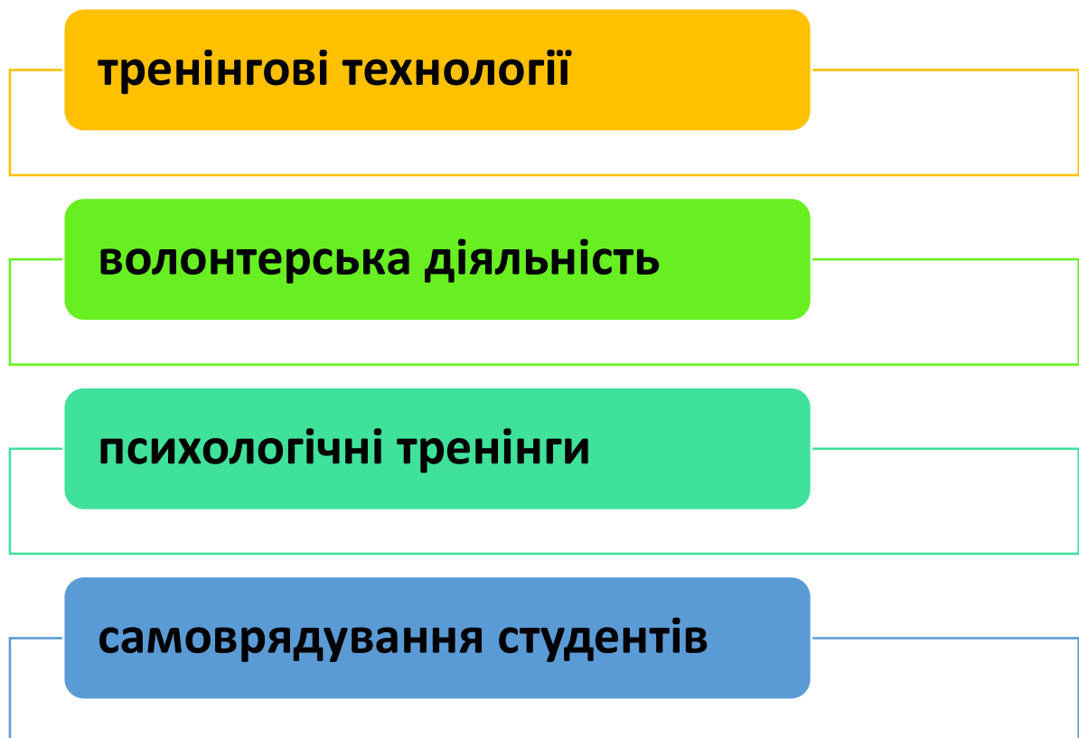
Рис. 2.1. Соціально-педагогічні умови формування соціального та емоційного інтелекту здобувачів освіти коледжу

Конкретизуємо кожну з представлених умов.