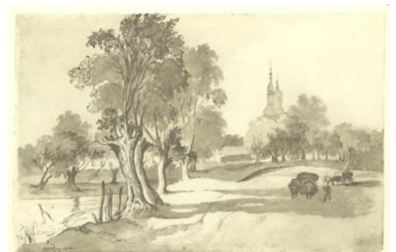
Рис. 1.4. Тарас Шевченко «Андруші», 1845 р.