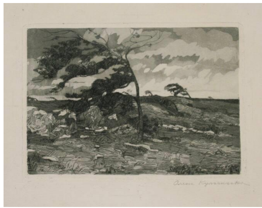
Рис. 1.8. Олена Кульчицька «Буря над Адріатичним морем», 1911 р.