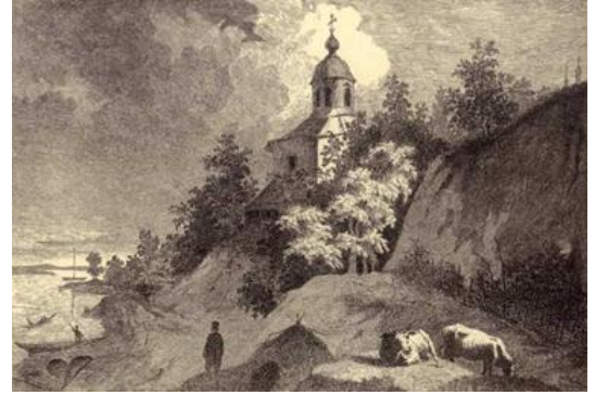
Рис. 1.2. Тарас Шевченко «Видубицький монастир у Києві», 1845 р.