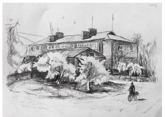
Рис.2.1-6. Пошукові ескізи до практичної частини кваліфікаційної роботи