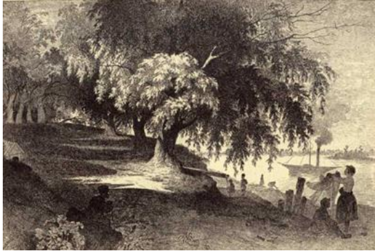
Рис. 1.1. Тарас Шевченко «У Києві», 1844 р.