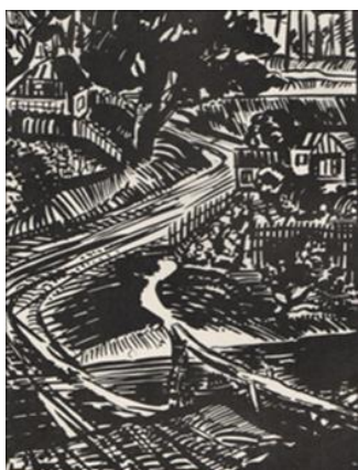
Рис.1.17. Сергій Конончук «Київ. Дорога на Татарській вулиці», 1929 р.