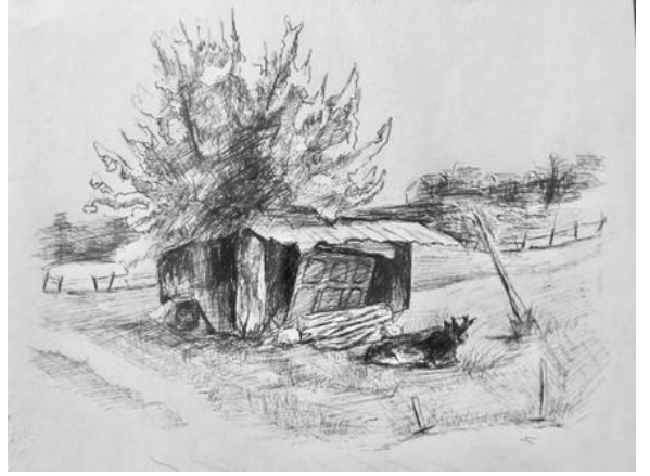
Рис.2.7-10. Пошукові композиційні ескізи до серії «Мій край»