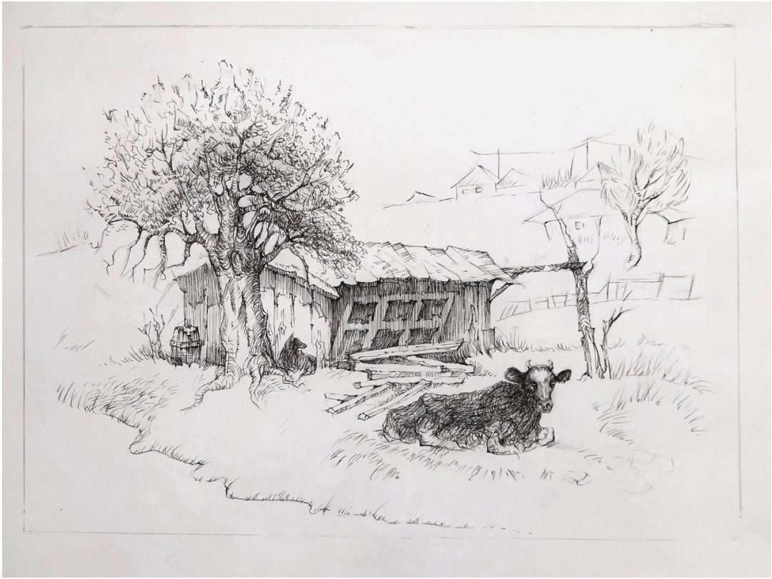
Рис.2.13. Пошук техніки виконання кваліфікаційної роботи