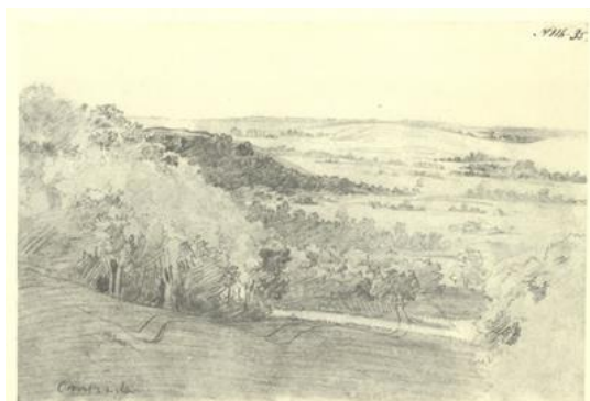
Рис. 1.5. Тарас Шевченко «Урочище Стінка», 1846 р.