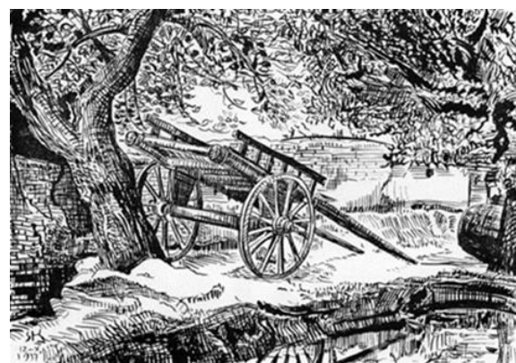
Рис.1.18. Сергій Конончук «Київ. Пейзаж», 1931 р.