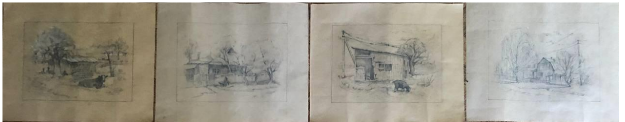
Рис.2.12. Експлікація серії (картони)