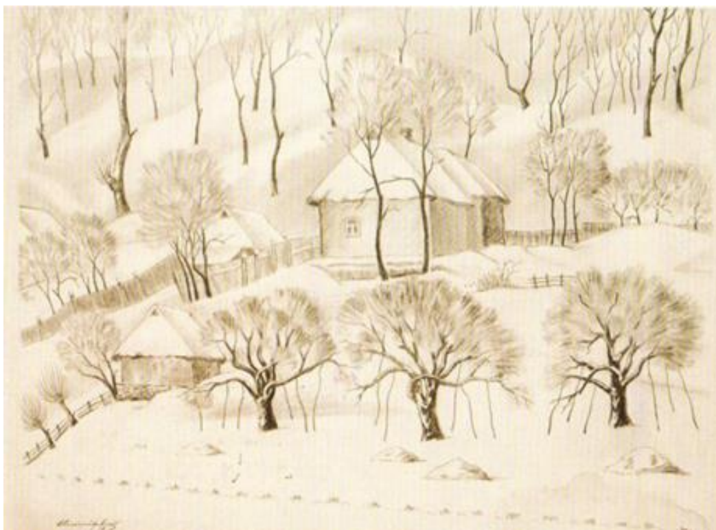
Рис.1.21. Іван Олександрович. «Седнів. Зима», 1978 р.