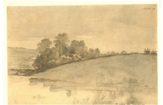
Рис. 1.6. Тарас Шевченко «Хутір на Україні», 1845 р.