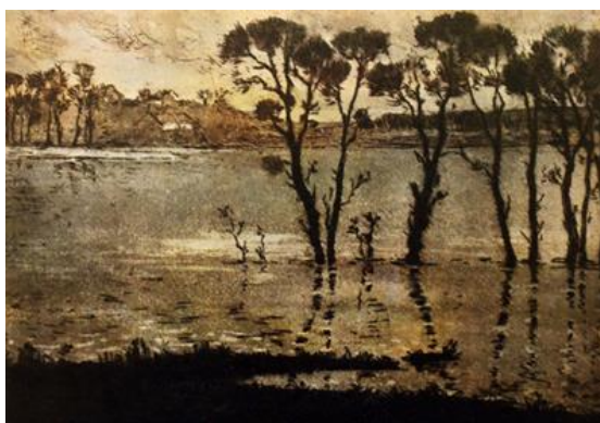
Рис.1.15. Михайло Дерегус «Повінь», 1940 р.