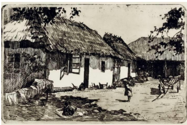
Рис.1.9. Олена Кульчицька «Хата під Львовом», 1930 р.