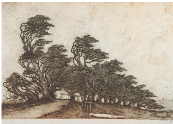
Рис.1.13. Михайло Дерегус «Вітер», 1940 р.