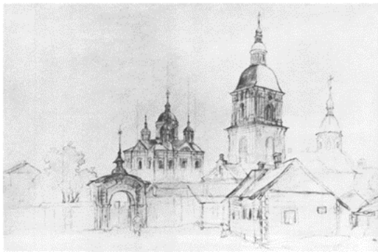
Рис. 1.3. Тарас Шевченко «Києво-Межигірський монастир», 1843 р.