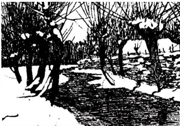
Рис. 1.7. Олена Кульчицька «Зима», 1909 р.