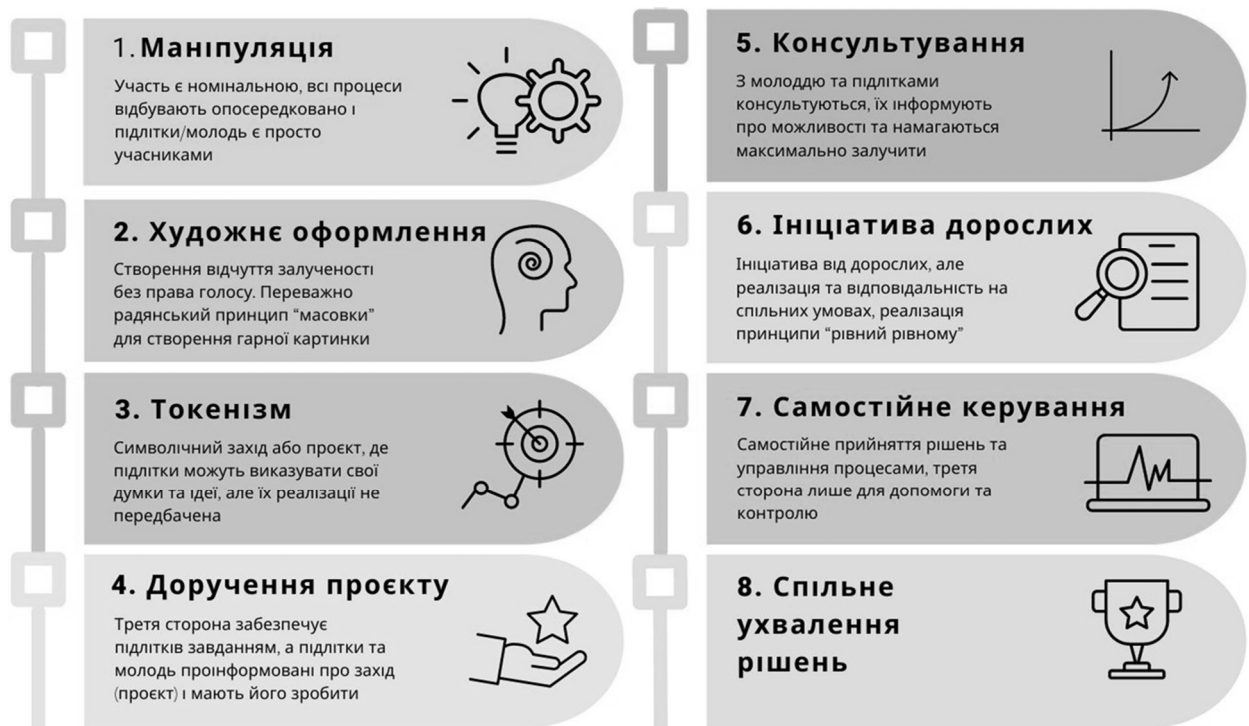
Рис. 2.1. Візуалізація «Драбини участі Харта»

Найбільш доречною системою аналізу залучення підлітків та молоді до соціально-громадського життя є «Драбина участі Харта» [26]. Для аналізу процесів залучення молоді Р. Харт у 1992 році запропонував власну модель участі дітей (підлітків, молоді) від номінальної участі до реалізації політичних прав у Дослідницькому центрі Інноценті Дитячого фонду ООН [26, с. 208]. Зупинімося детальніше на «Драбині участі Харта» [26] та візуалізуємо її в межах цього дослідження (Рис. 2.1).