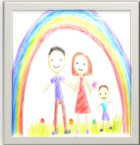
Серія малюнків «Кольорове щастя»