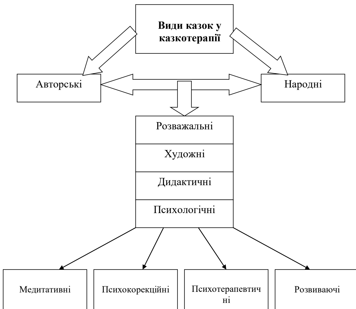
Схема класифікації казок, запропонована І.В. Вачковим