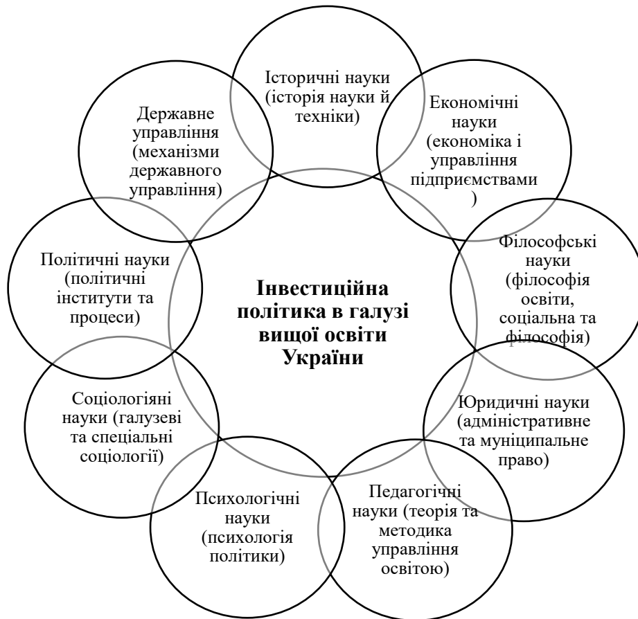
Рис. 2. Зв'язок інвестиційної політики в галузі вищої освіти України з іншими науковими галузями знань

Узагальнюючи викладені вище позиції науковців, зазначимо, що вивченню питання інвестицій у вищій школі присвячена значна кількість якісних праць. Проаналізовані дослідження мають системний та ґрунтовний характер, відображають погляди авторів та мають науково-прикладне знання, але в проаналізованих дослідженнях відсутній різнобічний характер вивчення питання. Основною проблемою сучасного наукового стану розробленості питання інвестицій у вищій школі є втрата міжгалузевих взаємозв'язків між освітньою політикою, інвестиціями, економічною та міжнародною діяльністю, що в результаті дає якісний галузевий або односторонній науковий продукт. Ця тенденція добре прослідковується в дослідників за науковими галузями, вчені-економісти розглядають питання інвестиції і відносять на другорядний план вищу школу, а провідні освітяни виводять на перше місце педагогічну науку, теорії та методики управління освітою, а вже потім питання інвестицій.