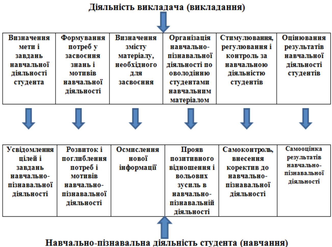
Схема1 Структура діяльності викладача та студента

Головним завданням освітнього процесу Криворізького державного педагогічного університету є всебічна і цілеспрямована підготовка майбутніх вчителів різного профілю до творчої життєдіяльності та конкурентноспроможності в сучасному світі. Освітній процес у педагогічному університеті – це система організацій навчально-пізнавальної діяльності майбутніх педагогів в її основу покладено поєднання діяльності викладача (викладання) і діяльності студента (навчання) (схема 1), що спрямована на всебічний розвиток особистості, формування її культури мислення та підготовки для подальшого професійного майбутнього.