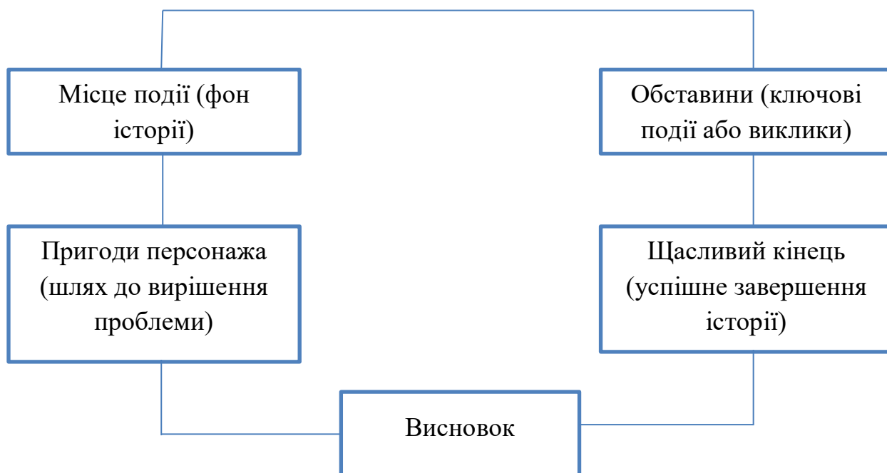
Рис.1.2. Основні компоненти успішного сторітелінгу

Сторітелінг в роботі з дітьми дошкільного віку: