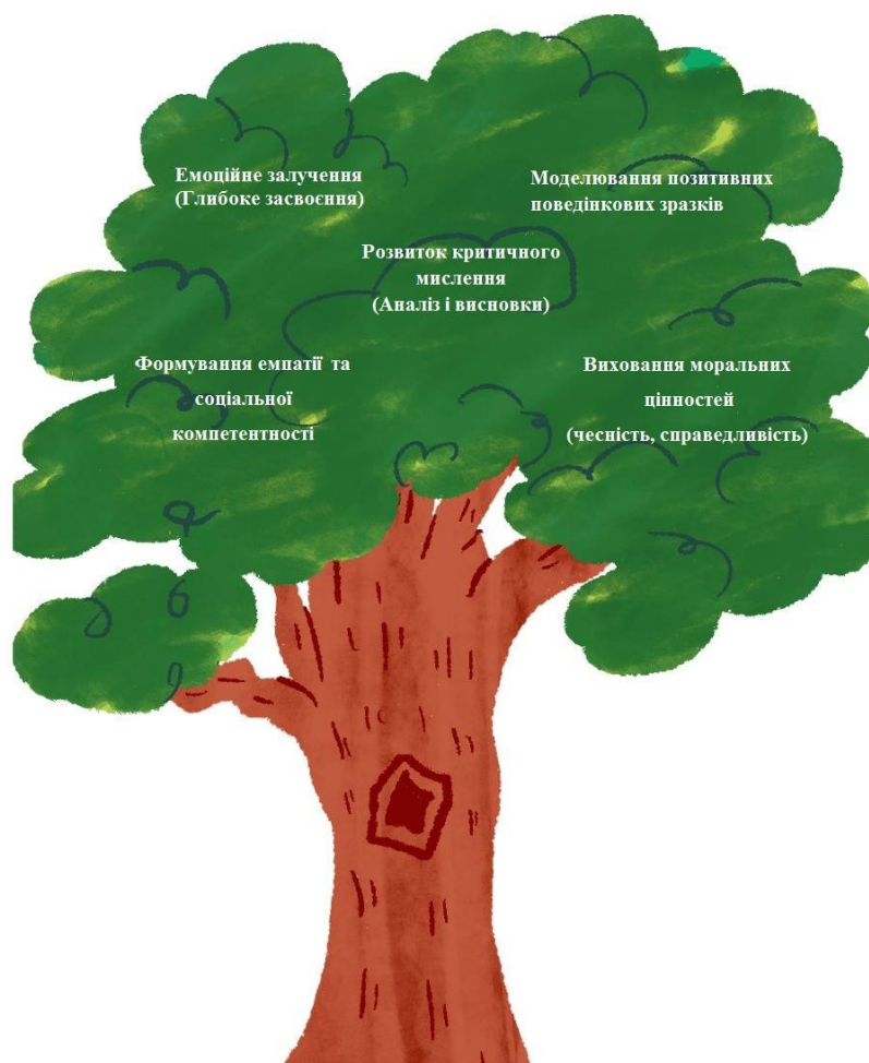
Рис.1.3. Дерево гуманних цінностей

Схематично зобразимо дерево гуманістичних цінностей на рис.1.3.