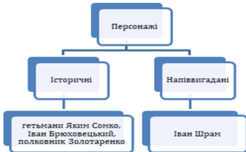
Рис. 2.1. Історичні та напіввигадані персонажі роману

Роману П. Куліша «Чорна рада. Хроніка 1663 року» притаманне докладне відтворення подій та зображення деяких історичних постатей. Це образи гетьманів Я. Сомка, І. Брюховецького, ніжинського полковника Золотаренка (В. Ніжинський), генерального писаря М. Вуяхевича (прихильник Сомка), московського окольничого князя Гагіна. Образ І. Шрама має прототип в особі І. Поповича, що спершу був козацьким полковником, а згодом здобув сан священника. Систему образів схематично представили на Рис. 2.1.