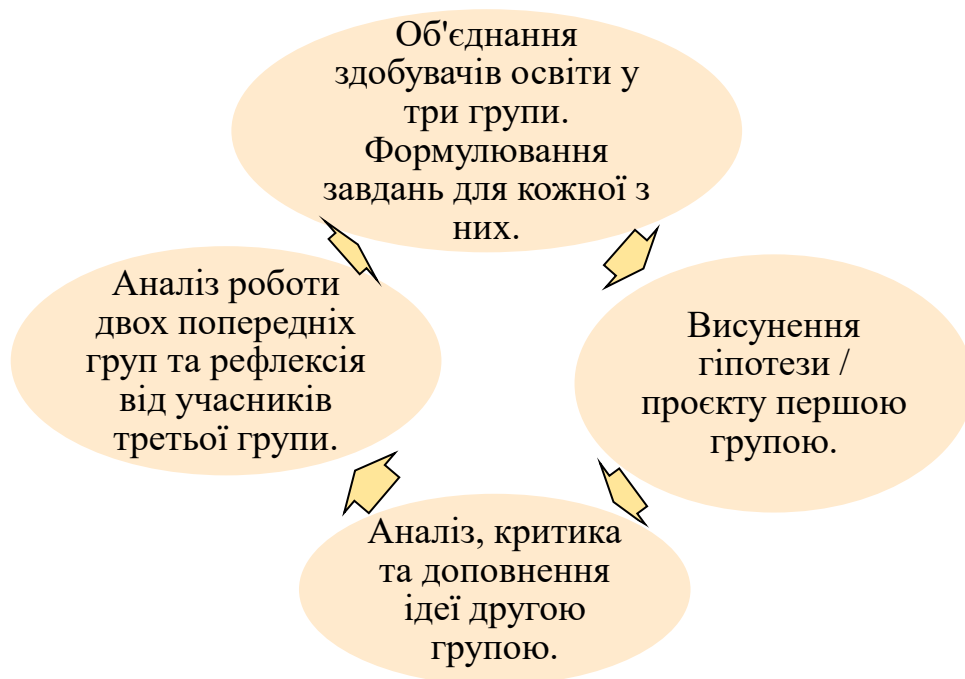
Рис. 3.1. Схема позиційної дискусії

мовної діяльності для пошуку ефективного розв'язання певної проблеми» [49, с. 78]. Наша ж увага спрямована на використання саме позиційної (в різних джерелах – рефлексивної) дискусії, що є рідше згадуваною в педагогічній практиці. Метод позиційної дискусії у порівнянні з іншими дозволяє залучити більшу кількість учасників для аналізу твору, дозволяє учнівству розвивати творче, логічне, критичне мислення та є способом «розвитку інноваційної поведінки» [46, с. 286]. Загальнопозиційна дискусія має ті ж завдання та вплив на роботу аудиторії, однак відрізняється процедурою проведення. Найголовнішою відмінністю є обов'язковий поділ класу на три групи, що мають різні завдання. Так, перша група є ініціатором гіпотези (пропонує проект вирішення проблеми), друга група (критики) має на меті осмислення та аналіз запропонованої ідеї та внесення своїх корективів, третя група – аналізує ідею та корективи до неї, формує висновки та рефлексію щодо роботи груп. Важливим є те, що склад груп після перебігу роботи груп можна (та варто) змінити, тоді ті, хто мав на меті критичне осмислення гіпотези, тепер мають створити свою і т.д. Отже, схема позиційної дискусії виглядатиме так (див. Рис. 3.1.):