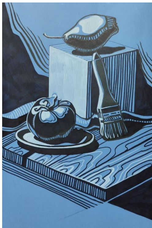
Рис.Д.2.7 Завершення роботи маркером