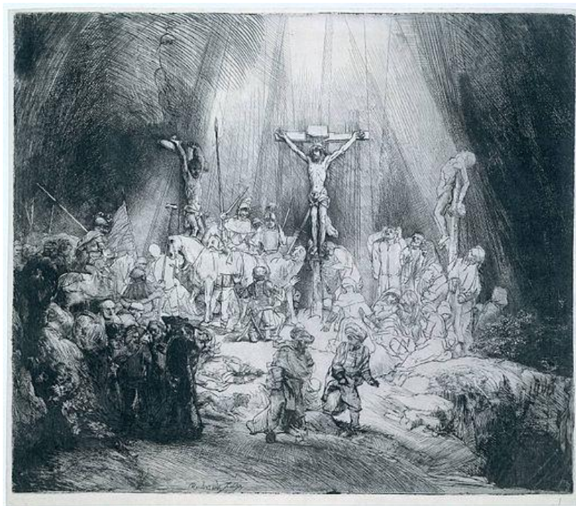
Рис.Г.1.3 твір виконаний у техніці сухої голки «The Three Trees» Рембрандт ван Рейн