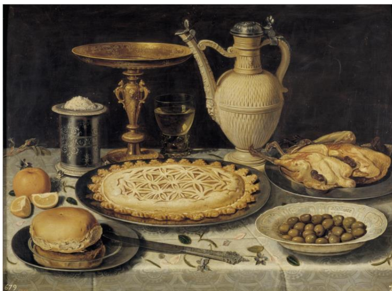
Рис.Г.1.1 “Стіл з апельсином, оливками та пирогом” Клара Петерс