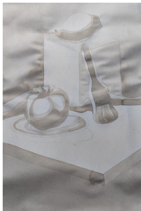
Рис.Д.2.4 Тоновий підмалюнок тушшю