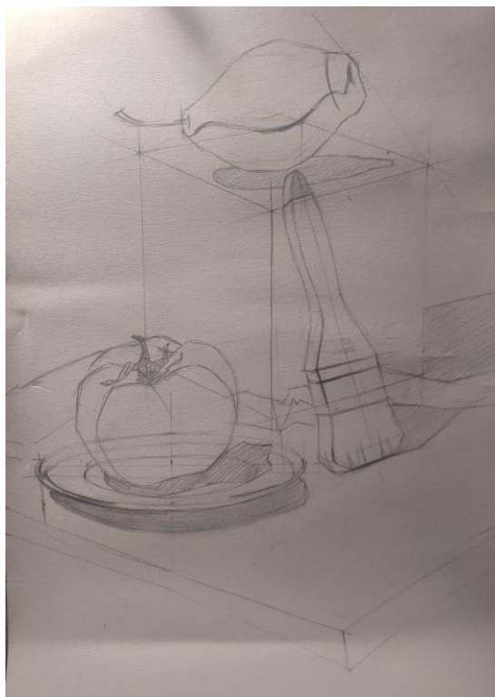
Рис.Д.2.1 Лінійно-конструктивна побудова предметів