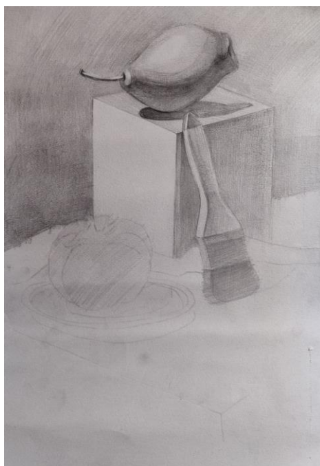
Рис.Д.2.2 Етап узагальненого світлотіньового моделювання форм