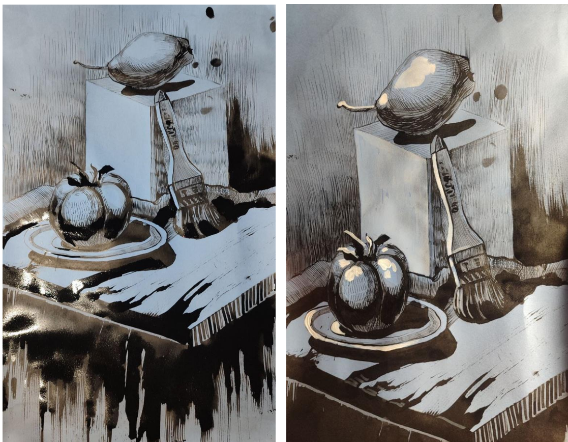
Рис.Д.2.5 Завернення роботи тушшю