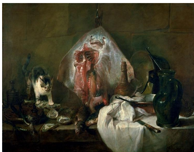
Рис.Г.1.4 «The Ray or, The Kitchen Interior»