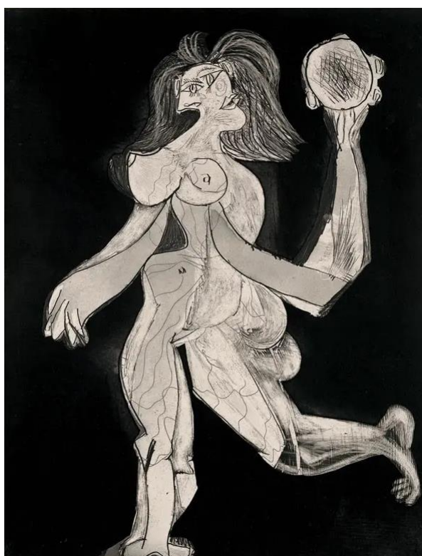
Рис.Г.1.2 “Жінка з бубном” Пабло Пікассо