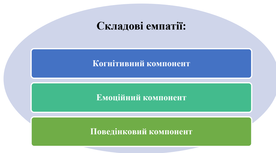
Рис. 1.1. Складові емпатії [ Джерело : 42]

Вчені висловлюють загальну думку про те, що емпатія як психічне явище має складну структуру у вигляді комплексу когнітивних, емоційних та поведінкових складових, що проявляються у міжособистісній соціальній взаємодії. На рисунку 1.1. зображена модель емпатії в єдності її складових: