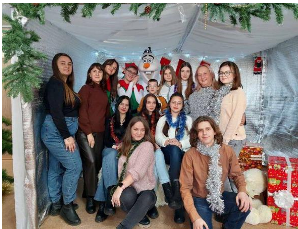
Напередодні Нового 2024 року. Святкування з колегами кафедри дошкільної і спеціальної освіти та студентами, КДПУ, 29 грудня 2023 року.