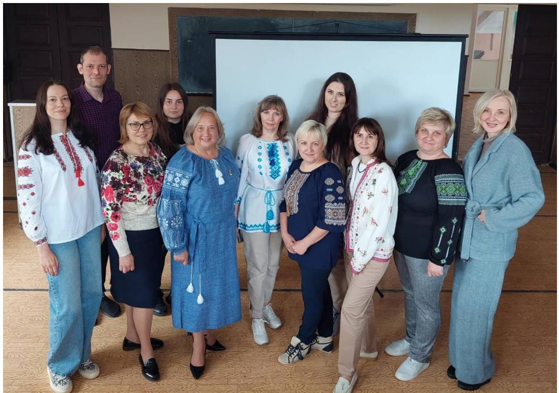
Участь кафедри дошкільної і спеціальної освіти в міському заході до Дня науки, м. Кривий Ріг, КДПУ, 16 травня 2024 року.