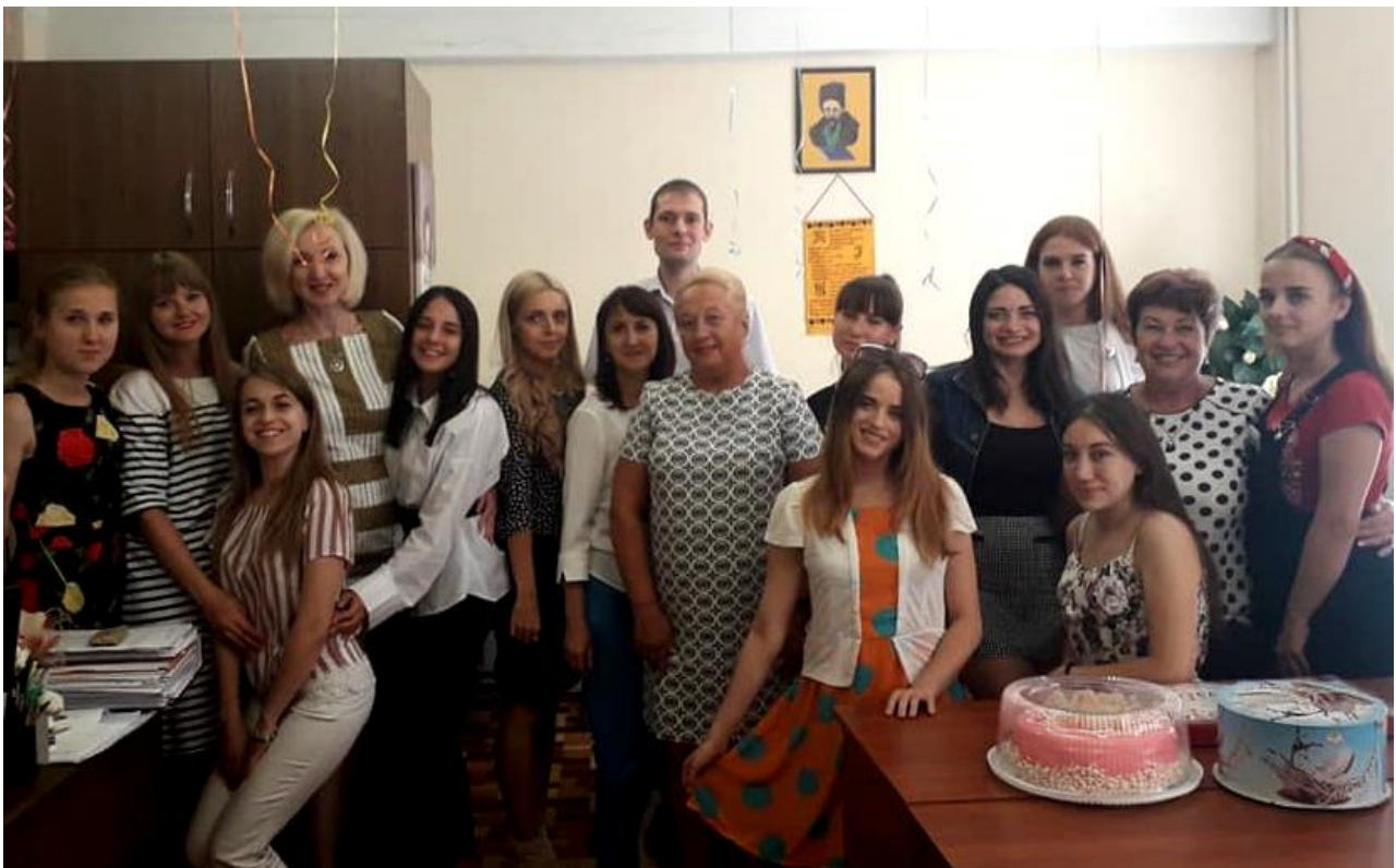
Кафедра дошкільної освіти святкує 10-річний ювілей, КДПУ, 9 вересня 2019 року.