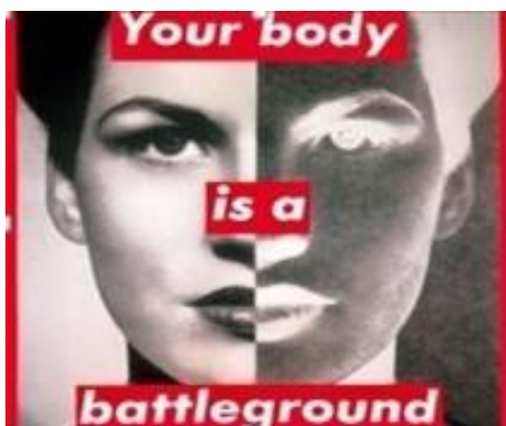
Рис.1.6. «Untitled» Барбара Крюгер.