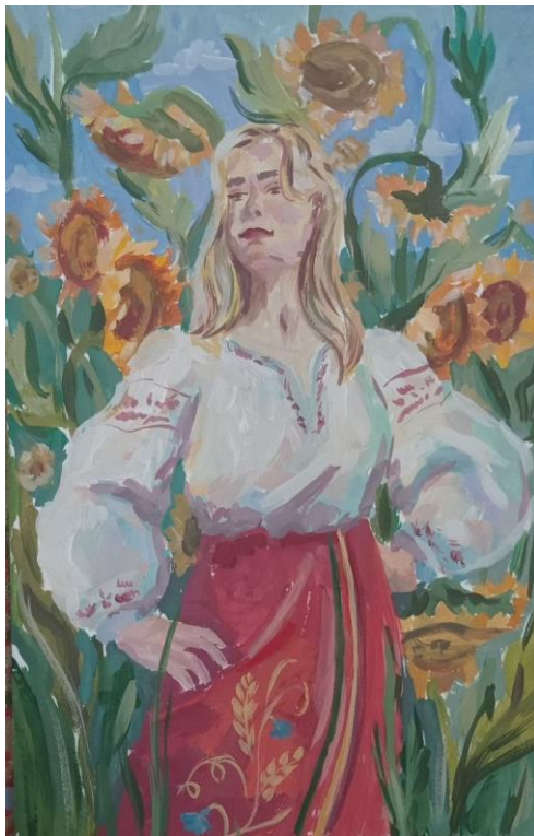
Рис.2.17. Третій ескіз.