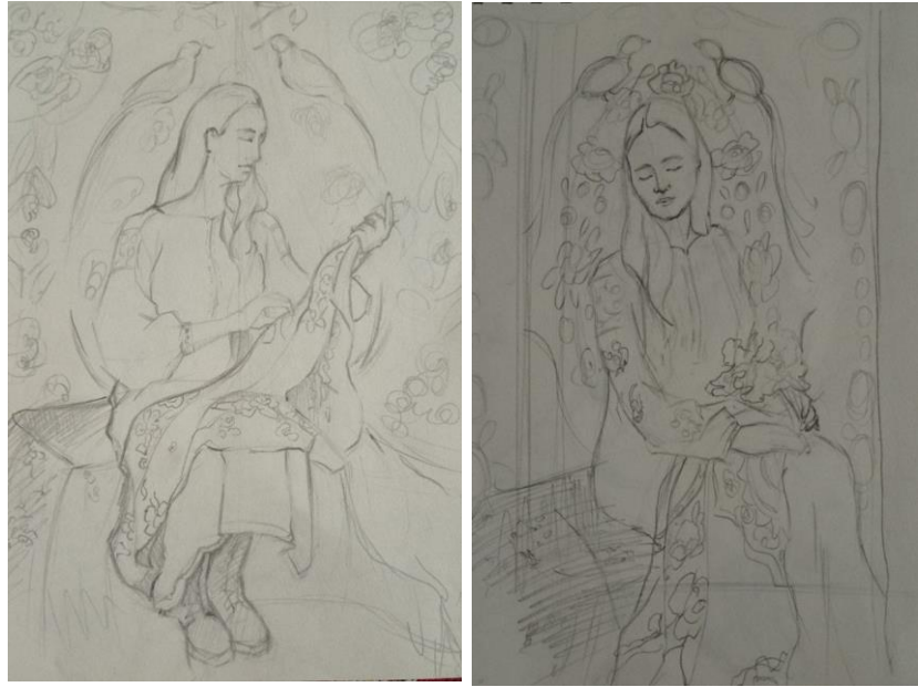
Рис.2.1-13. Пошукові начерки.