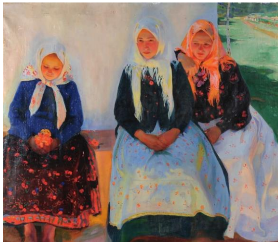
Рис. 1.10. «Неділя» Олександр Мурашко 1911р.