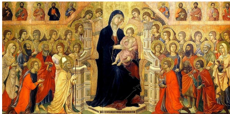
Рис.1.3. Центральна панель величезної вівтарної картини «Маєста» (Величність) для Сієнського собору роботи Дуччо ді Буонінсенья.