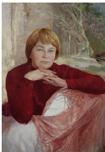
Рис.1.12. «Портрет жінки в червоному» Юрій Клапоух, 2008р.