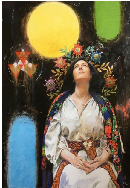
Рис.1.13. «Сайарсична Трійця і Темна ніч душі» Катерина Білалетіна, 2021р.