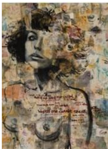
Рис.1.8. «Жіночий портрет» Моллі Крабапл.