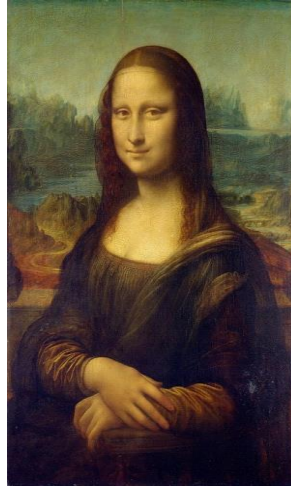
Рис.1.1. Леонардо да Вінчі «Мона Ліза», 1503-1505 рр.