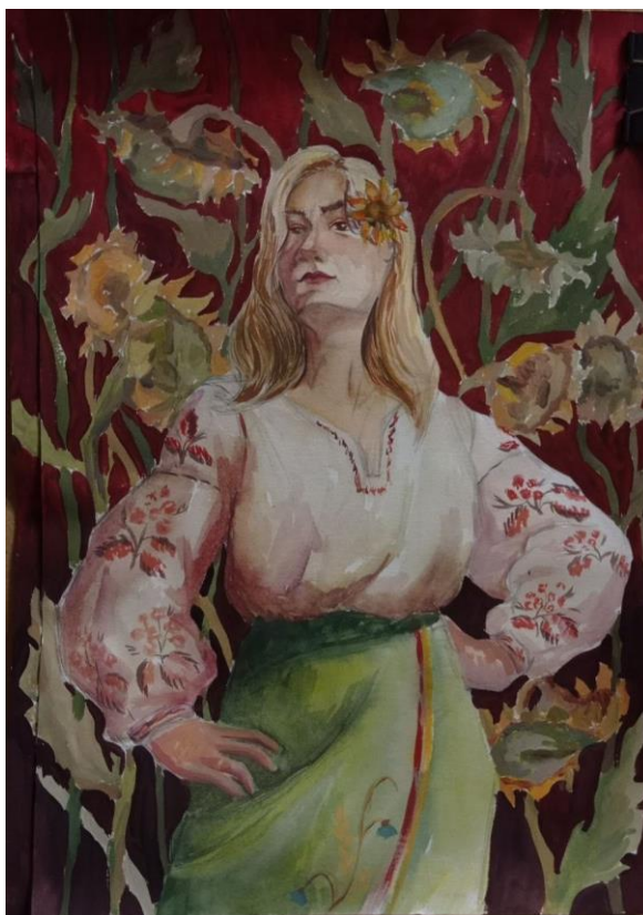
Рис.2.16. Другий ескіз.