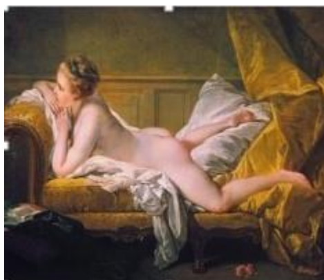
Рис.1.5. «Одаліска» Франсуа Буше, 1752 р.