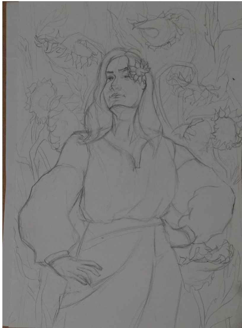
Рис.2.14. Композиційне вирішення майбутньої роботи.