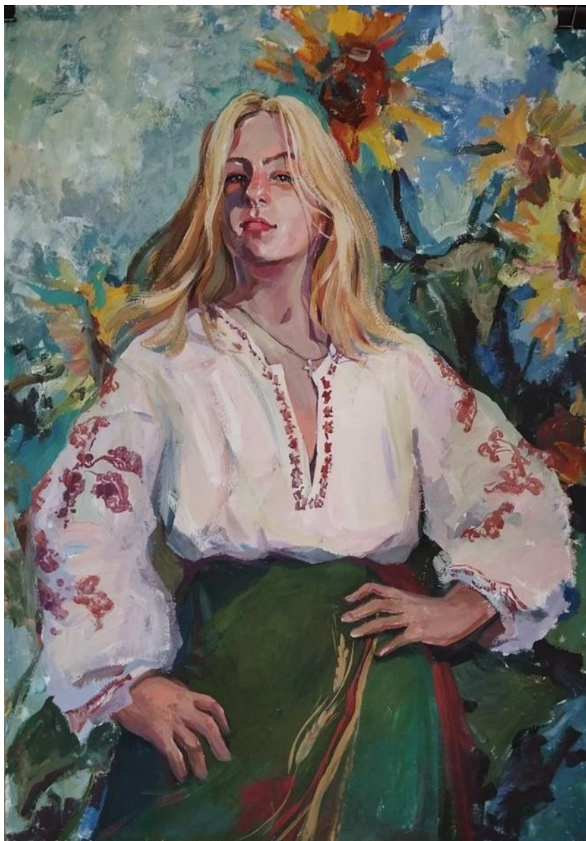
Рис. 2. 19. Кваліфікаційна робота «Вільна».