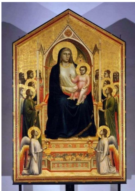
Рис.1.4. «Мадонна Онїссанті», Джотто ді Бондоне.