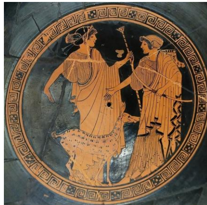
Рис.1.2 «Аполлон та Артеміда». Червонофігурне тондо на килику, близько 470 р. до н.е.