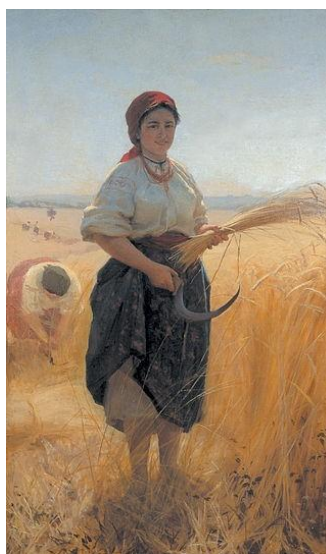
Рис.1.9. «Жниця» Микола Пимоненко, 1889 р.