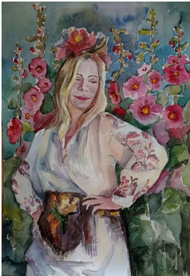
Рис.2.15. Перший ескіз.