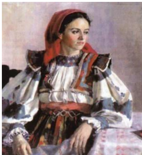
Рис.1.11. «Дівчина з Колочави» Андрій Коцка.