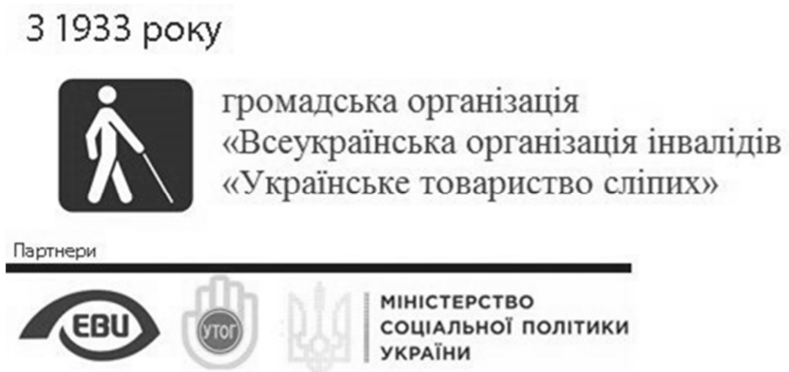
Рис. 2.1. Емблема Українського товариства сліпих

Одним з яскравих прикладів соціального підприємництва в Україні можна вважати діяльність Українського товариства сліпих (УТОС). Як організацію Українське товариство сліпих почало свою діяльність у 30-х роках ХХ століття [34]. До нині товариство опікується різноманітними напрямками роботи з людьми з інвалідністю, що мають порушення зору.