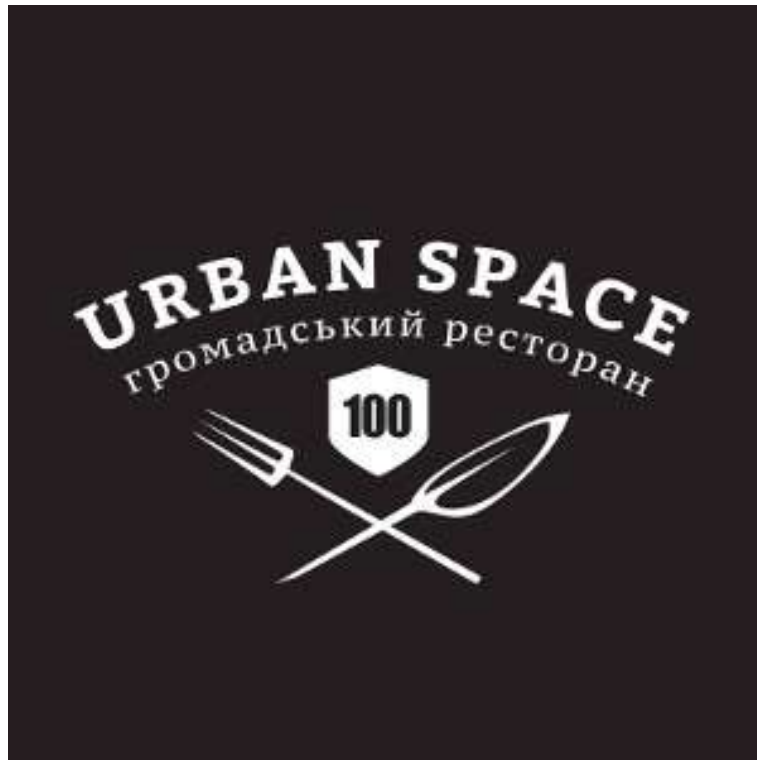
Рис. 2.3. Емблема Громадського ресторану «Urban Space»

Цікавою формою соціального підприємництва можна вважати Громадський ресторан «Urban Space» [41]. Ідея громадського ресторану бере свій початок від соціальної відповідальності, коли 100 (сто) відповідальних громадян з різних куточків України об'єднались здала створення інноваційної платформи для реалізації ідей. На офіційному сайті громадського ресторану зазначається, що основна ідея його функціонування полягає в «тому, що 80% прибутку ресторану направлено винятково на реалізацію громадських проектів» [41].