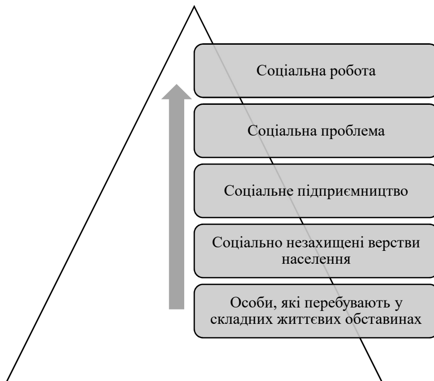
Рис. 1.3. Ієрархія сутності та змісту базових понять дослідження

За результатами визначення сутності та змісту базових понять дослідження побудуємо їх ієрархію у вигляді схеми (Рис. 1.3).