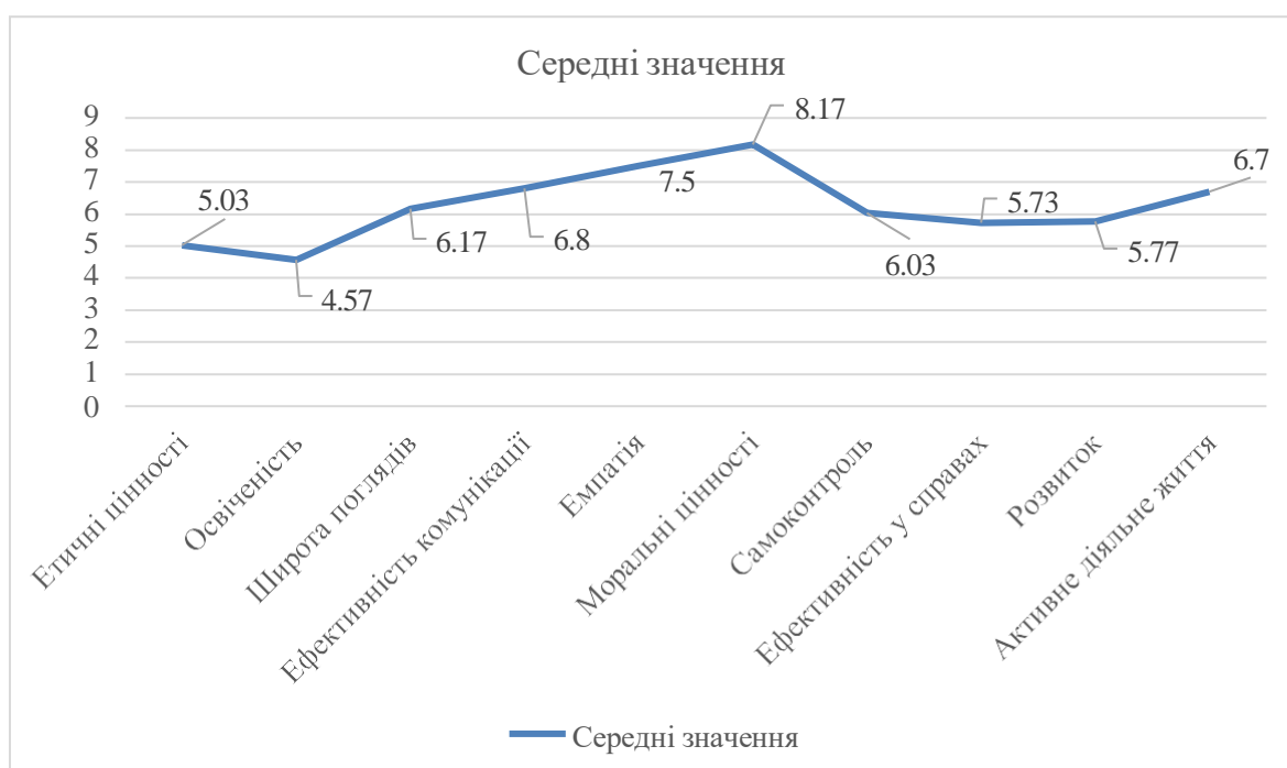
Рис.2.2. Профіль професійних цінностей студентів-психологів

На рис. 2.2 графічно представлений профіль професійних цінностей студентів-психологів.