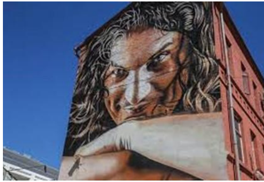
Рис.2.2.1. Мурал, присвячений Кузьмі Скрябіну

Шило О.В., Івашко О.Д зазначають, що сучасний стріт-арт є новітнім різновидом монументального мистецтва, побудованого на новітніх засадах естетики. Разом з цим при дослідженнях стріт-арту розрізняють стріт-арт як різновид практики монументального мистецтва сучасності та теоретичну проблематику стріт-арту як монументального мистецтва, через те, що численна кількість населення бачить стріт-арт тільки проявом вандалізму, не вбачаючи в ньому естетичної складової. Стріт-арт можна вважати спадкоємцем монументального мистецтва з попередніх періодів з усталеними традиціями [9, с. 27].