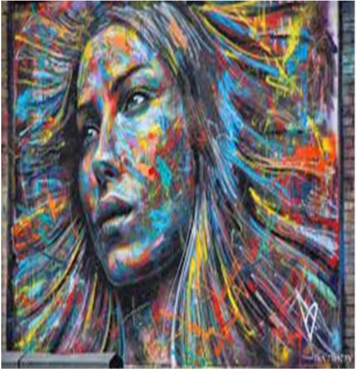
Фото 1. Мурал «Україна»