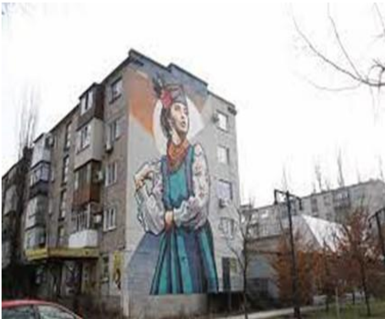
Фото 2. Мурал «Слобожанка» в Авдіївці