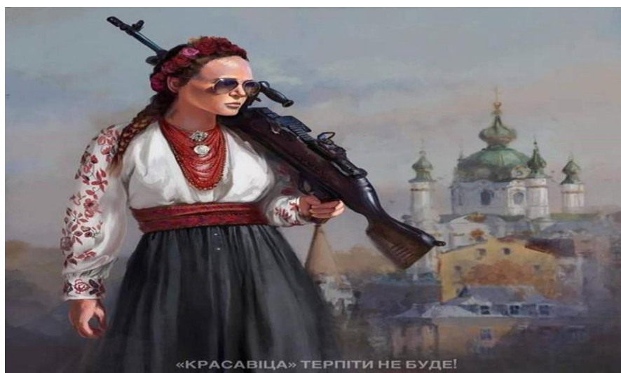
Рис. 3.2.1. Мурал «Красавица терпіти не буде». Автор К.Качановський

З початку повномасштабної війни український стінопис набрав нових обертів і має найчастіше патріотичний характер. Таким чином художники виявляють своє бажання найскорішої перемоги.