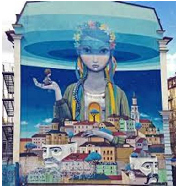
Рис. 2.2.2. Мурал «Українська дiвчина». м.Київ

Спiрним став i мурал на Андрiївському узвозi у Києвi, що зображує «сумну» українську дiвчину. Цей об'єкт викликав критику як за вiдсутнiсть художнього смаку, так i за невiдповiднiсть традицiйним уявленням про українську жiночнiсть. Проте автори муралу стверджують, що вiн має глибокий сенс i вiдображає iхнє бачення суспiльної ситуацiї та вiру у «ренесанс» України.