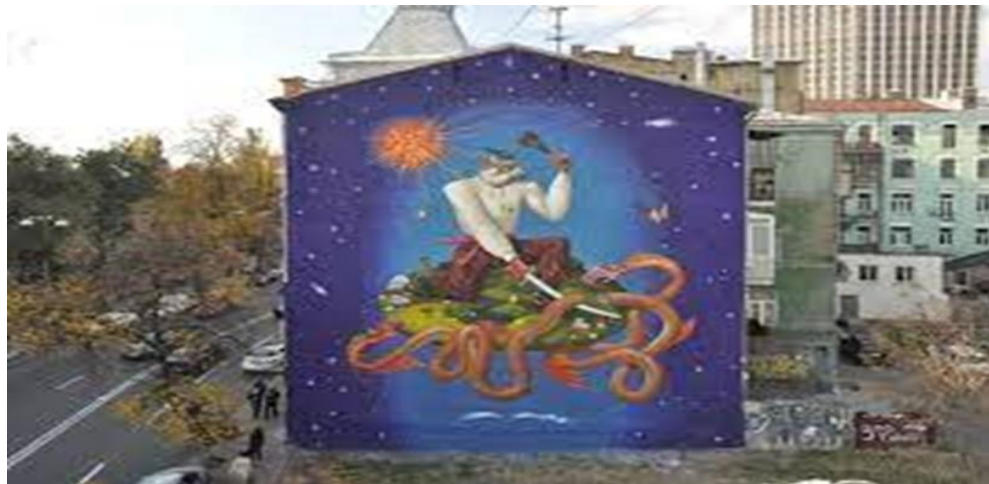
Рис.2.2.3 Мурал «Святий Юрій». м. Київ.

Формат стріт-арту надає художникам можливість реалізувати найсміливіші творчі ідеї, оскільки вони вільні від канонічних правил інших мистецьких форматів. Українські міста, які часто були сприйняті як бідні таневиразні післярадянські простори, прикрашаються та перетворюються завдяки вуличному малярству.