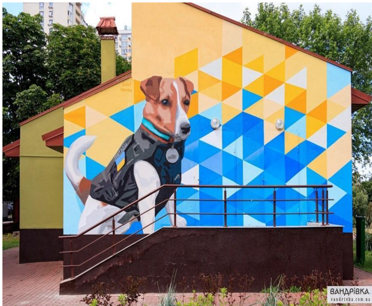
Рис.3.2.2. Мурал «Патрон». Автори В. Гідеван та О. Нойна

Київ став третім містом в Україні, де створили стрит-арт з відомим сапером псом Патроном (рис.3.2.2.). Мурал можна побачити в парку «Відрадний». Ініціатором стінопису став «Київзеленбуд» Солом'янського району, а підтримали таку ідею й допомогли її втілити пара художників Віталій Гідеван та Олена Нойна [18].