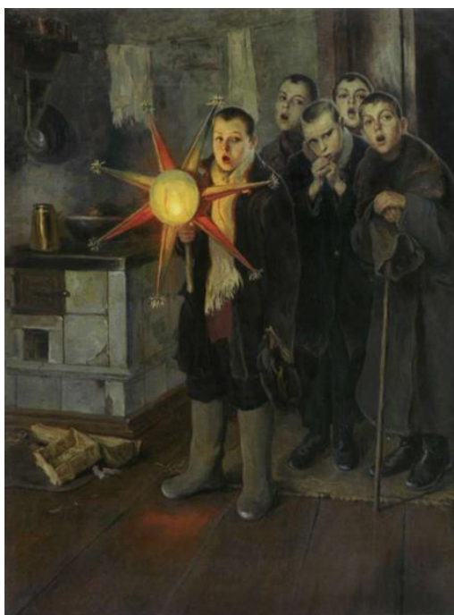
Рис.1.5. Пимоненко М. «Колядки», 1885р.