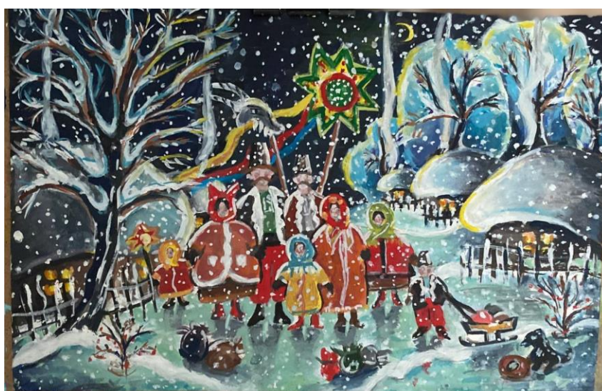
Рис.2.12. Колористичні пошуки