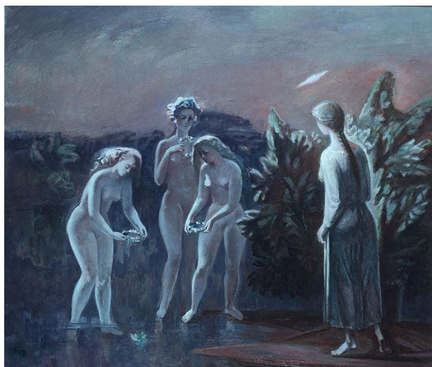
Рис.1.14. Белянський О. «Ніч на Івана Купала»