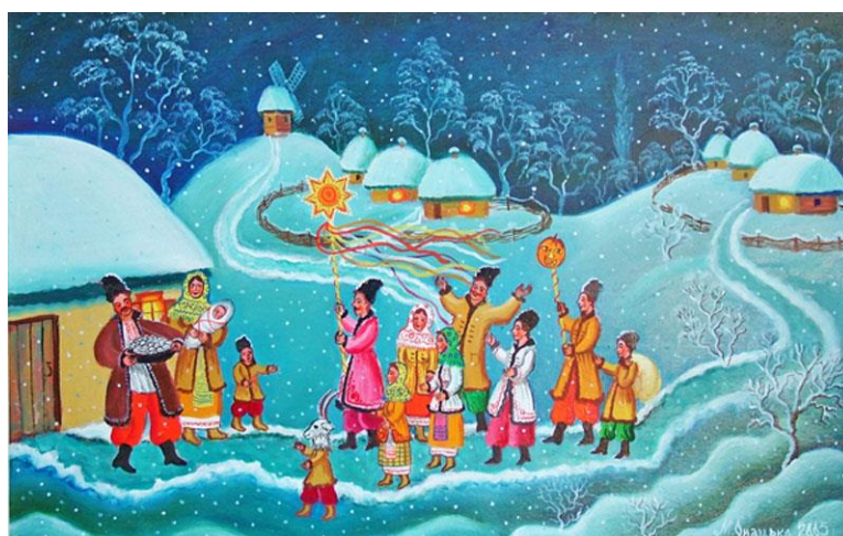
Рис.1.6. Онацько М. «Щоб було вам в ложці, місці і в колисці»