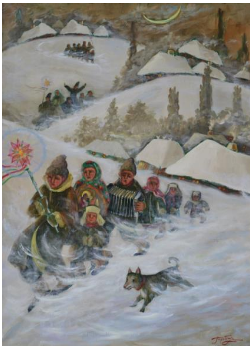
Рис.1.10. Горобчук І. «Різдвяна Хуртовина», 2011р.