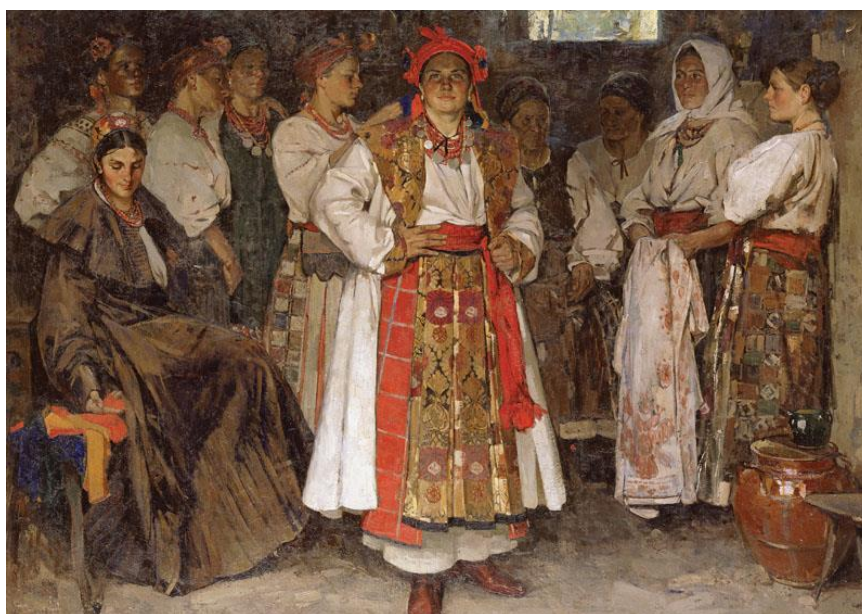
Рис.1.2. Кричевський Ф. «Наречена», 1910р.