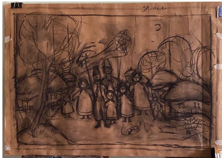
Рис.2.5. Форескізні пошуки