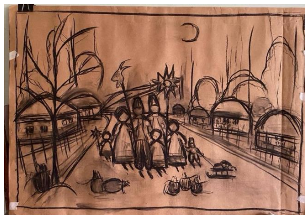
Рис.2.3 – 2.4. Форескізні пошуки