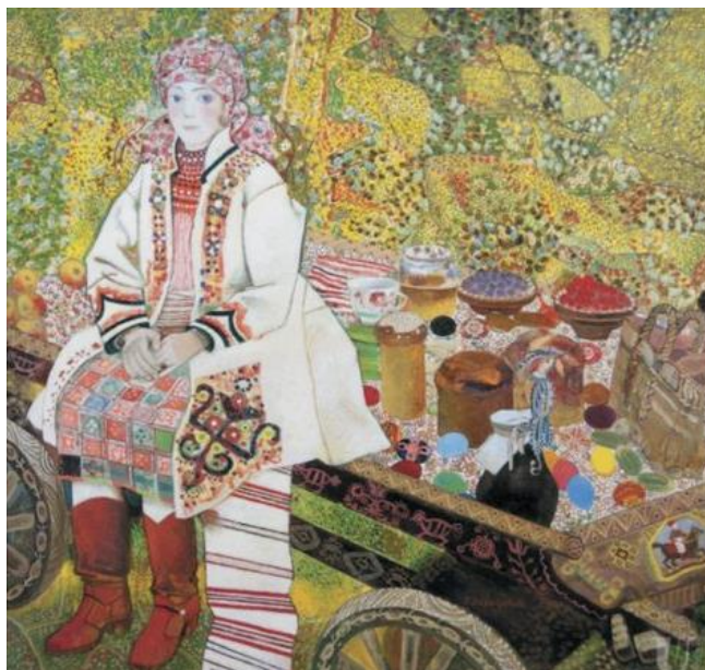
Рис.1.13. Зарецький В. «Солдатка», 1987–1988рр.