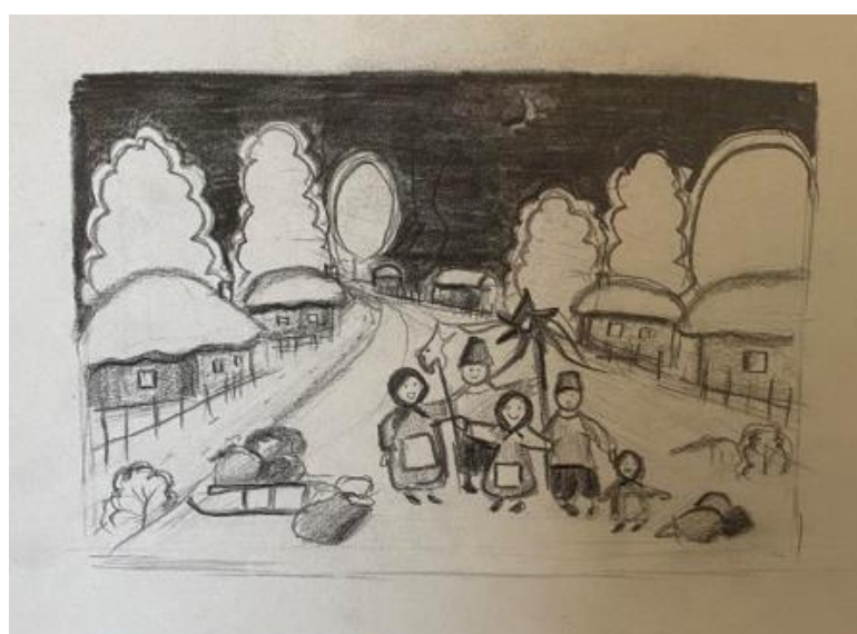
Рис.2.1-2.2. Композиційні пошуки