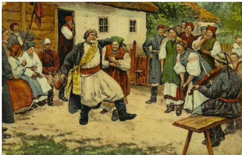
Рис.1.1. Пимоненко М. «Українське весілля», 1897р.