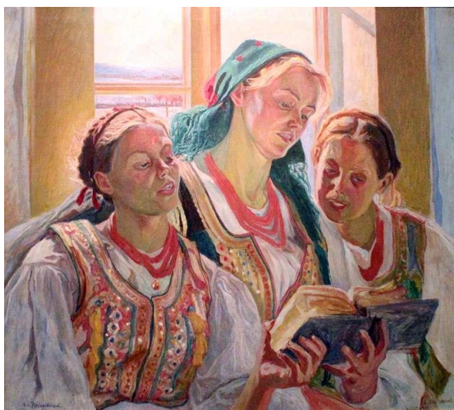
Рис. 1.11. Новаківський О. «Коляда», 1907–1910 рр.