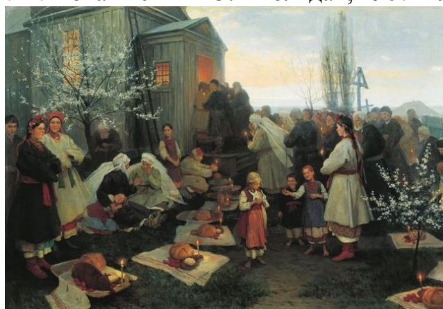
Рис.1.12. Пимоненко М. «Великодняя утренья», 1891р.