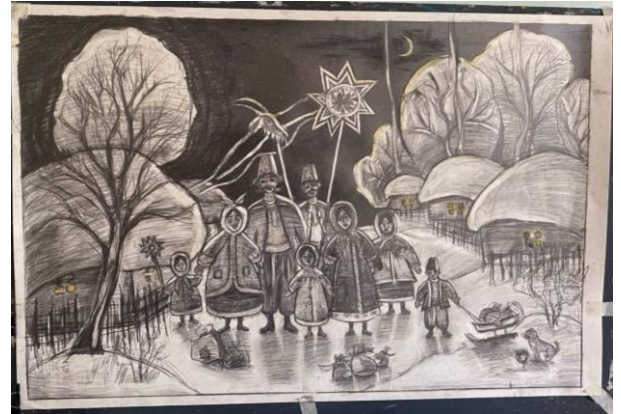
Рис.2.8. – 2.9. Тональні вирішення, робота над картоном