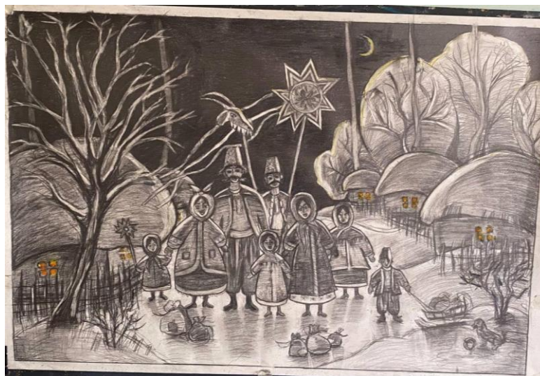
Рис.2.10. Тональне вирішення композиції, затверджений картон