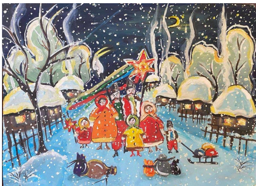
Рис.2.11. Колористичні пошуки