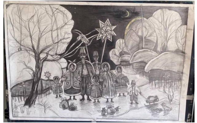
Рис.2.6. – 2.7. Тональні вирішення, робота над картоном