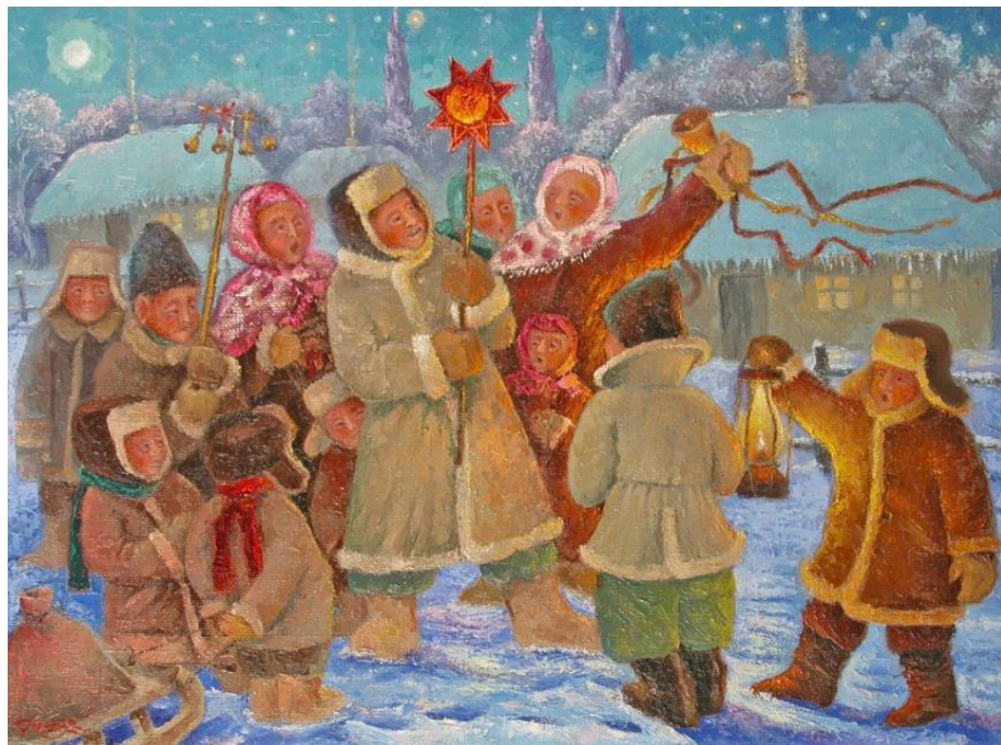
Рис.1.9. Горобчук І. «Вертеп», 2005р.