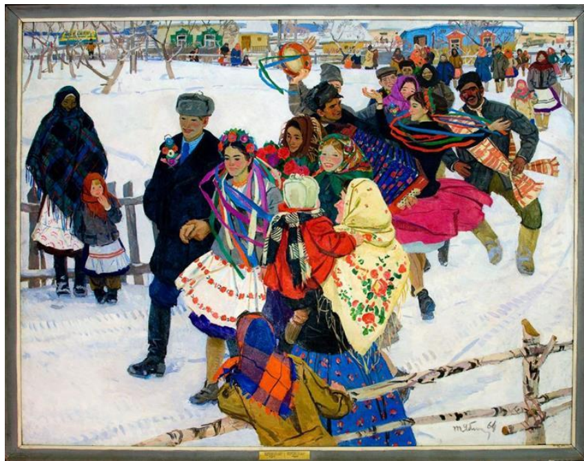
Рис.1.4. Яблонська Т. «Весілля», 1964р.