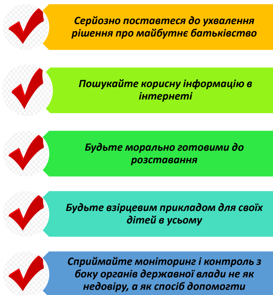
Рис. 2.2. Методичні рекомендації потенційним батькам-вихователям