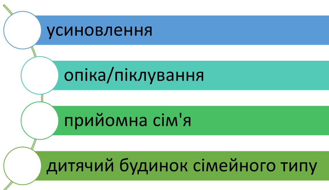
Рис. 1.2. Основні форми сімейного виховання дітей-сиріт та дітей, позбавлених батьківського піклування в Україні

Вихованцями таких форм є діти-сироти та діти, які позбавлені батьківського піклування. Очевидно, що кожна з представлених форм сімейного виховання є свої переваги та недоліки у порівнянні одне з одним. Проте, держава робить все можливе, для того, щоб дитина, яка опинилася в