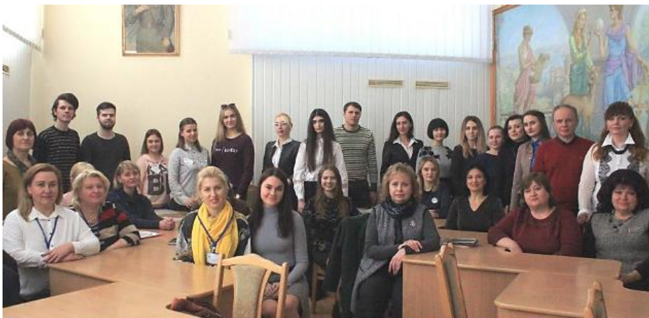
Регіональний науково-практичний семінар «Навчання впродовж життя як концептуальна ідея розвитку сучасної моделі освіти», КДПУ, 20 березня 2019 р.