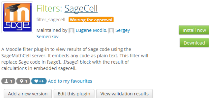
Рис. 1. Сторінка фільтра SageCell у сховищі плагінів Moodle

форматування між псевдотегами при створенні нової сторінки курсу, тесту, повідомлення та інших об'єктів, що опрацьовуватимуться фільтром.