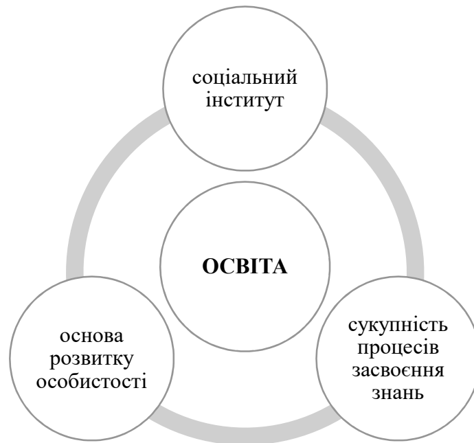
Рис. 1.1. Результат проведеного комплексного термінологічного дослідження дефініції «освіта» у колективній монографії.

Схематичне відображення результату проведеного комплексного термінологічного дослідження дефініції «освіта» є у колективній вітчизняній монографії «Концептуально-технологічна модель підготовки майбутніх фахівців соціально-педагогічної сфери» [10, с. 13]. Отримані результат відобразимо у цій роботі у Рис. 1.1.