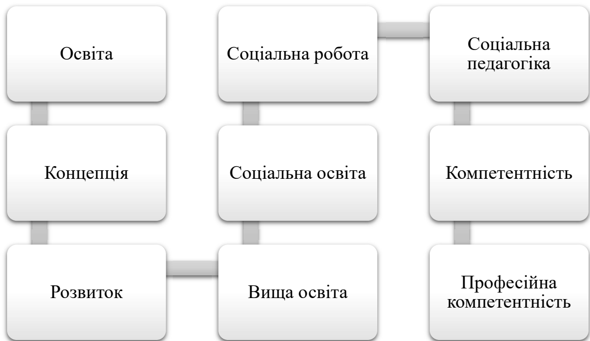
Рис. 1.2. Базові та похідні дефініції дослідження за ієрархічним принципом

Схематичне відображення базових та похідних дефініцій дослідження за ієрархічним принципом у Рис. 1.2.