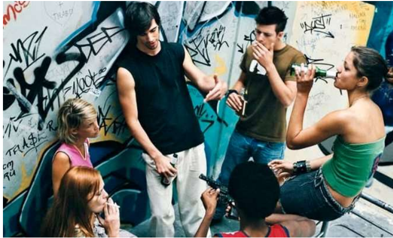
Рис. 1.3. Девіантна молодь