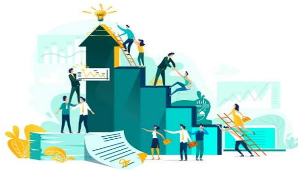
Рис. 1.1. Роль освіти в житті людини

Розуміння освіти як процесу, що спрямоване на показ наступним поколінням соціально-значущого й культурно-історичного досвіду (В. Ледньов), як процесу і результату засвоєння індивідом умінь, навичок, знань а також морально-естетичної культури (С. Гончаренко), як цілеспрямованого процесу виховання і навчання в інтересах людини, суспільства й держави ( Закон України «Про освіту») перейшло до нових характеристик поняття «освіта». На сьогодні освіта розглядається як засвоєння особою узагальненого соціального досвіду, норм та цінностей під дією зовнішнього впливу, це сфера соціального життя людини, неперервний розвиток індивіда, суспільства та людської цивілізації загалом. Освіта, як соціальнокультурний інститут відображає єдність навчання, виховання, розвитку та саморозвитку особистості, що сприяє функціонуванню та вдосконаленню суспільства [2].