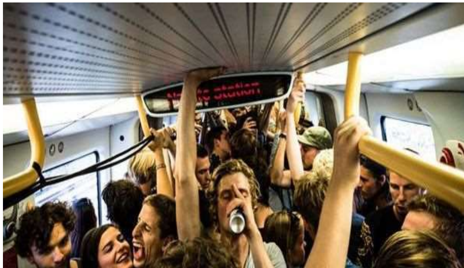
Рис. 1.4. Девіантні прояви молоді

Фактори, які впливають на причини виникнення девіантної поведінки розглянула та розкрила у свої працях М. Галагузова. Вона виокремила наступні: