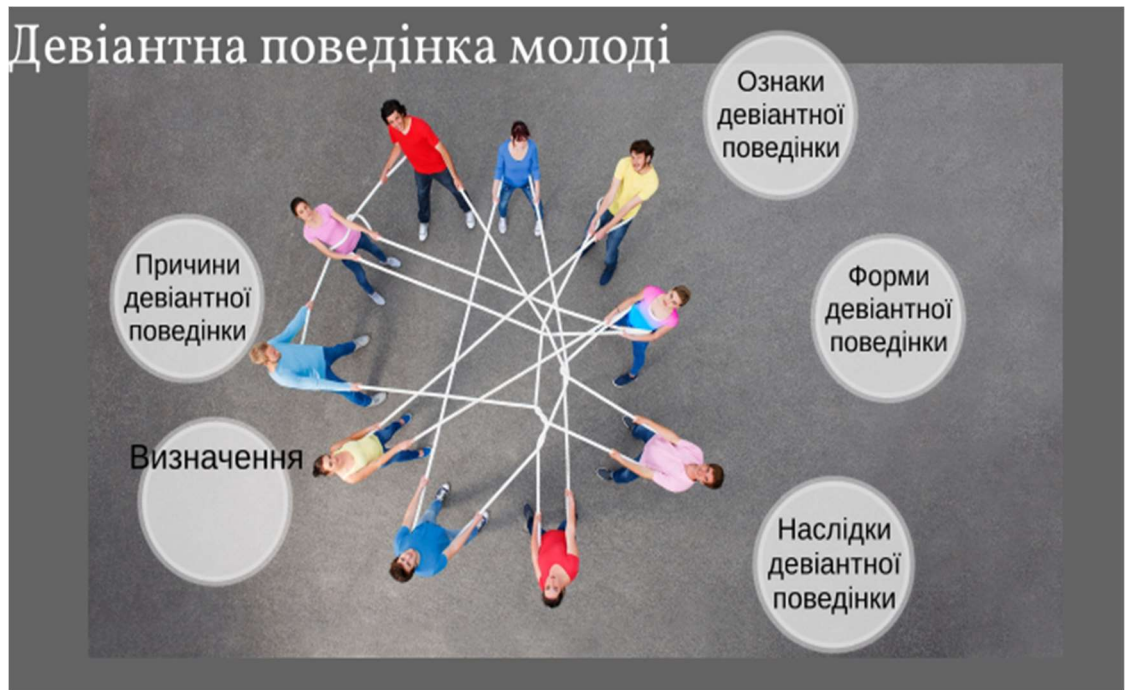
Рис .1.2. Девіантна поведінка учнівської молоді.

Особливості відхиленої поведінки учнівської молоді полягають в тому, що ранній юнацький вік є дуже складним. По-перше, позначаються внутрішні труднощі перехідного віку від дитинства до дорослості, починаючи з психологічних і фізіологічних процесів і закінчуючи перебудовою власного «Я». По-друге, обмеженість і невизначеність соціального статусу молодої людини. По-третє, протиріччя, викликані реконструкцією механізмів соціального контролю (наївні форми контролю, засновані на підпорядкуванні зовнішнім нормам і вимогам дорослих, уже не діють, а дорослі методи, пов'язані за свідомим стримуванням і самоконтролем це не зміцнилися) [24].