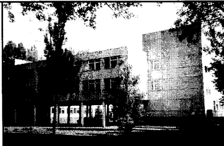
Кривий Ріг. Гуманітарний корпус педуніверситету. Тут останні роки працював Василь Скрипка. Фото 2000 року.