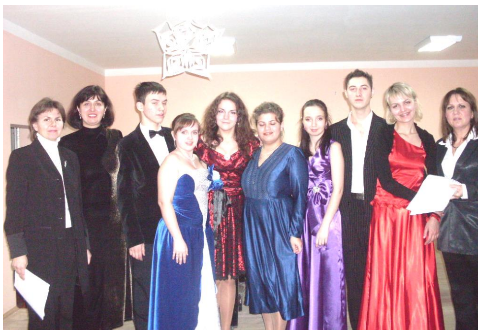
Студія академічного співу, 2010 р.