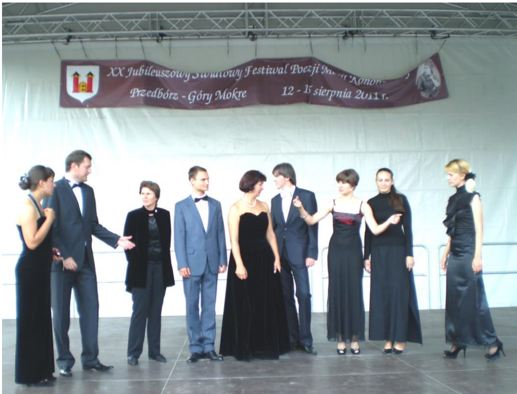
Перед виступом: студія академічного співу (м. Пшедбудж, Польща), 2011 р.