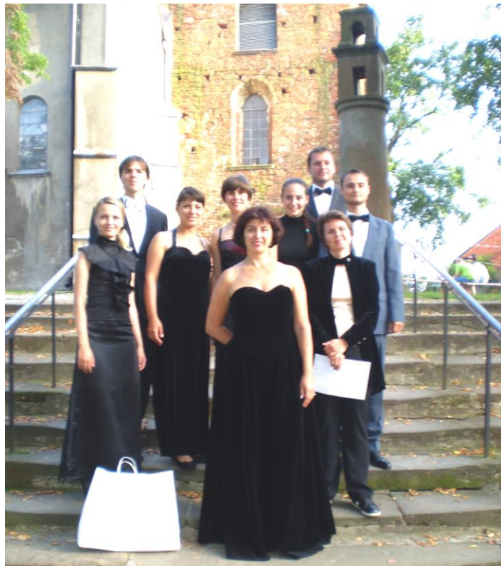
Переможці Міжнародного конкурсу ім. М. Конопницької (м. Пшедбудж, Польща), 2011 р.