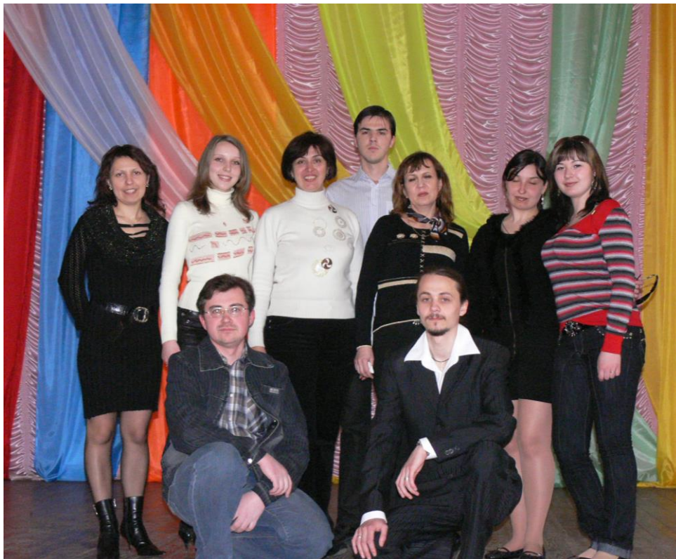
Студія академічного співу, 2007 р.