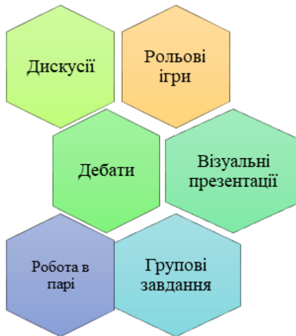
Рис. 3.3. Інтерактивні методи навчання – ефективні інструменти для поглиблення розуміння літературних монологів

Одним із таких методів є дискусії, які дозволяють учням активно обмінюватися думками та аргументами щодо певного монологу або теми твору. Під час дискусій учні не лише висловлюють свої думки, але й слухають однокласників, аналізують їхні погляди, що сприяє розвитку критичного мислення та комунікативних навичок. Дискусії також допомагають учням глибше зрозуміти різні інтерпретації монологу і дозволяють побачити його в ширшому контексті твору.