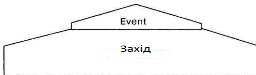
Рис. 1. Захід та його «івентивна» складова

Але в обох випадках захід/івент, порушуючи звичайний ритм життя, вже самим фактом свого здійснення стає джерелом збурення інформаційного середовища та потужних комунікативних сигналів. Зважаючи на те, що порушення звичайного ритму життя спряжене з емоційними переживаннями та враженнями учасників, причетних, комунікативний вплив подій на оточуючих значно більший, ніж від вербальних текстів. Прораховується й суспільний розголос (резонанс), що в сучасну добу неможливий без участі ЗМІ. І навпаки: івент та ефект від нього знецінюється, якщо він залишився непомітним у суспільстві, не опинився у інформаційному середовищі та на «порядку денному» громадськості та ЗМІ, залишив байдужими його учасників.