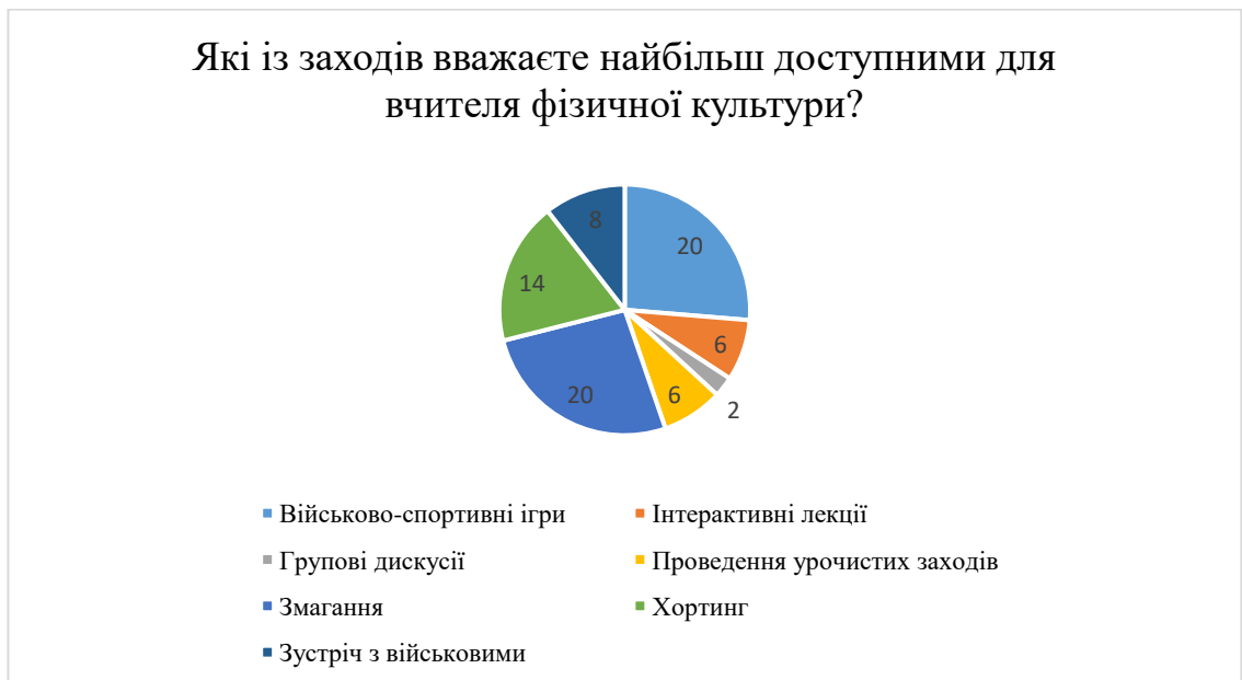
Рис. 2.14. Результати відповідей на запитання «Які із заходів вважаєте найбільш доступними для вчителя фізичної культури?»

Результати анкетування можуть бути використані для вдосконалення змісту освітніх програм, спрямованих на підготовку вчителів фізичної