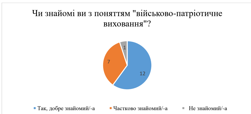
Рис. 2.1. Результати відповідей на запитання «Чи знайомі ви з поняттям "військово-патріотичне виховання"?»

Результати опитування зображені на діаграмах 2.1-2.14.