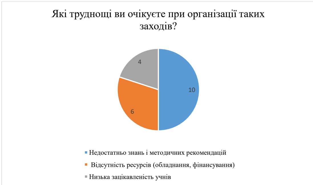
Рис. 2.9. Результати відповідей на запитання «Які труднощі ви очікуєте при організації таких заходів?»