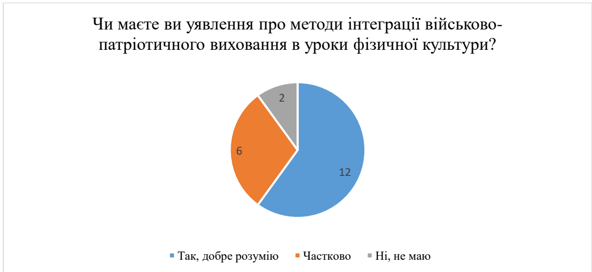
Рис. 2.13. Результати відповідей на запитання «Чи маєте ви уявлення про методи інтеграції військово-патріотичного виховання в уроки фізичної культури?»