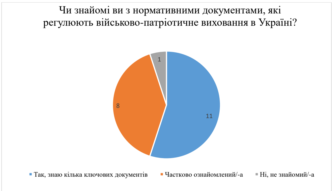
Рис. 2.6. Результати відповідей на запитання «Чи знайомі ви з нормативними документами, які регулюють військово-патріотичне виховання в Україні?»