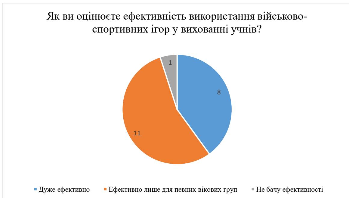
Рис. 2.11. Результати відповідей на запитання «Як ви оцінюєте ефективність використання військово-спортивних ігор у вихованні учнів?»