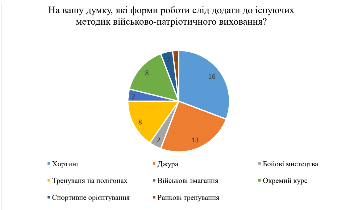
Рис. 2.10. Результати відповідей на запитання «На вашу думку, які форми роботи слід додати до існуючих методик військово-патріотичного виховання?»