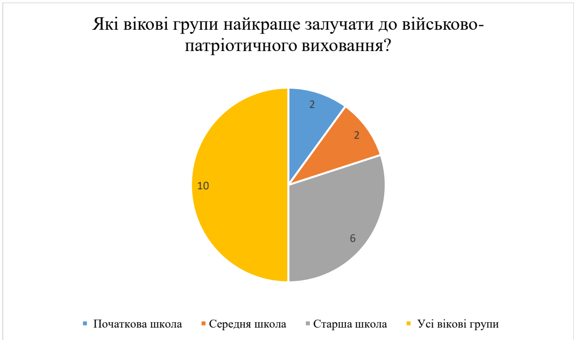
Рис. 2.5. Результати відповідей на запитання «Які вікові групи найкраще залучати до військово-патріотичного виховання?»