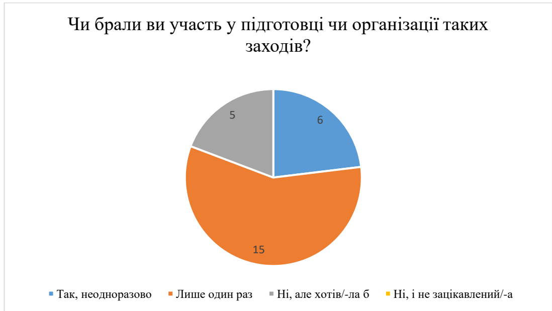
Рис. 2.3. Результати відповідей на запитання «Чи брали ви участь у підготовці чи організації таких заходів?»