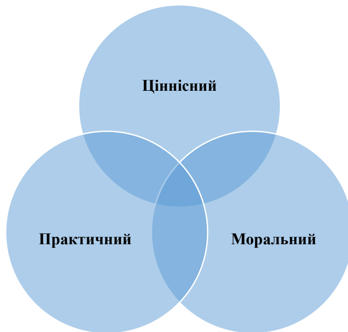
Рис. 1.3. Компоненти військово-патріотичного виховання

Практичний компонент зосереджується на розвитку конкретних навичок і вмінь, які необхідні для захисту країни та безпеки у кризових ситуаціях. Сюди входить навчання основ військової справи, домедичної допомоги, орієнтування на місцевості, використання базових засобів захисту і виживання. Практичний компонент передбачає участь у військово-спортивних змаганнях, заняттях зі стрільби та тактичних іграх, які формують командний дух, швидкість реакції та стресостійкість.