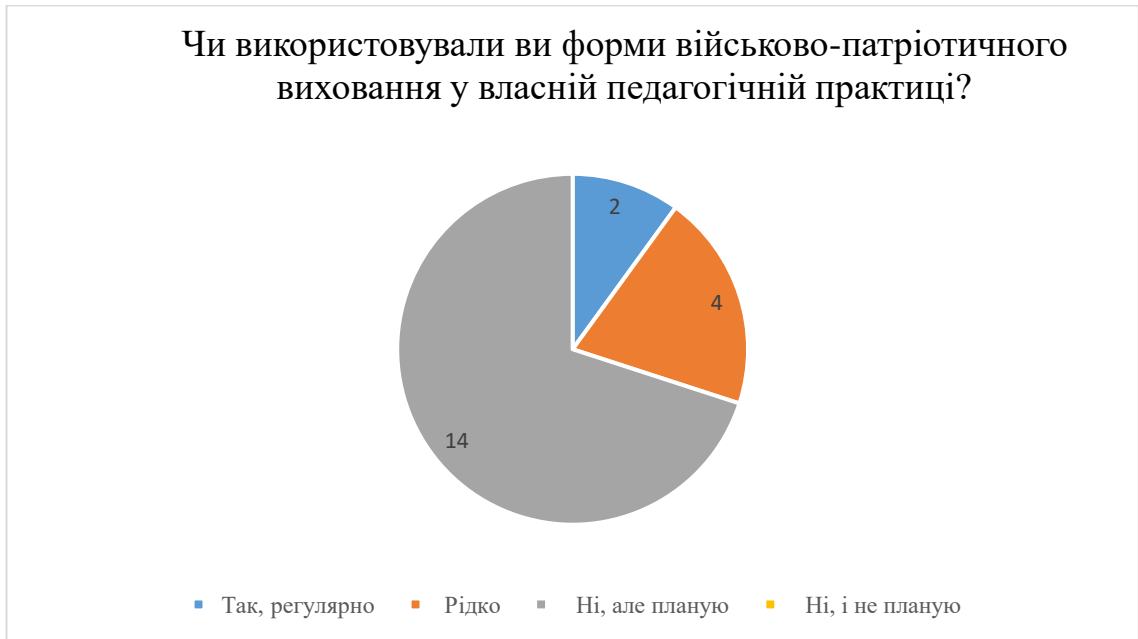
Рис. 2.7. Результати відповідей на запитання «Чи використовували ви форми військово-патріотичного виховання у власній педагогічній практиці?»