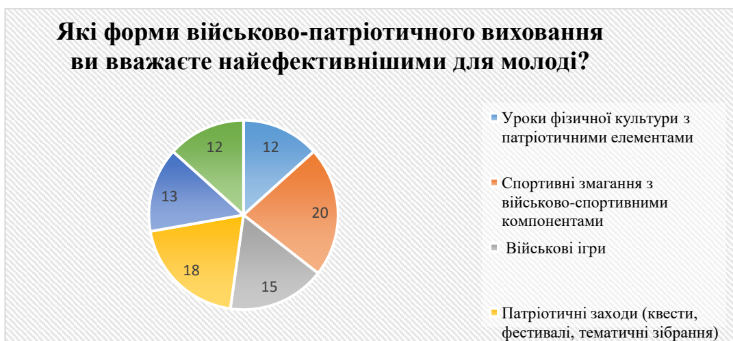
Рис. 2.2. Результати відповідей на запитання «Які форми військово-патріотичного виховання ви вважаєте найефективнішими для молоді?»