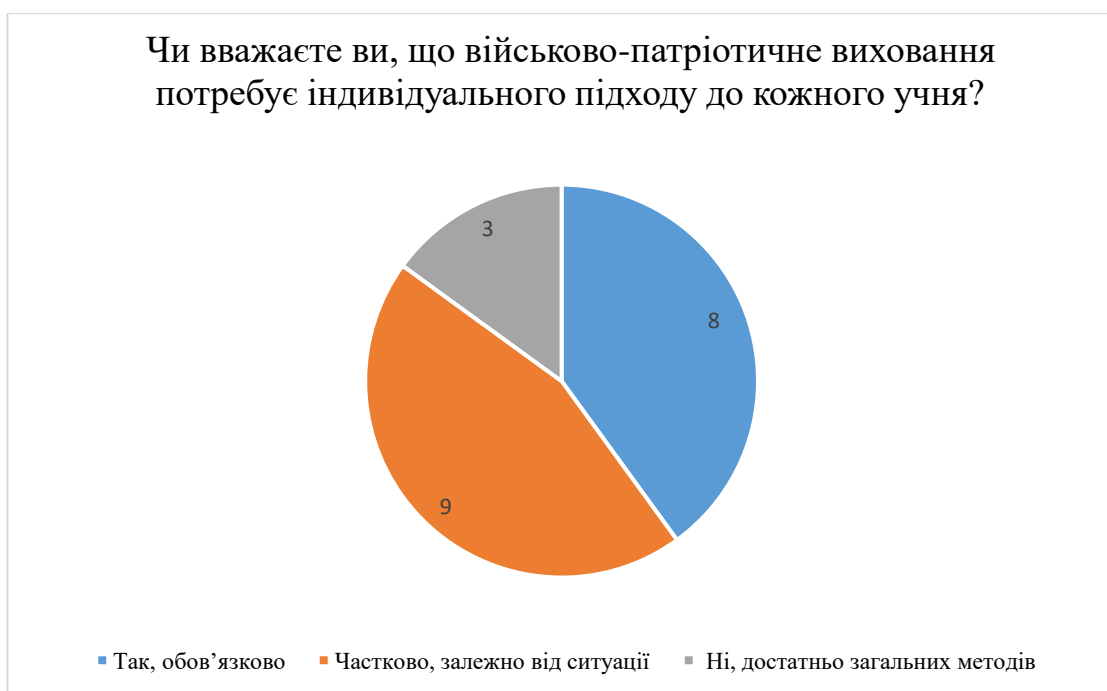
Рис. 2.12. Результати відповідей на запитання «Чи вважаєте ви, що військово-патріотичне виховання потребує індивідуального підходу до кожного учня?»