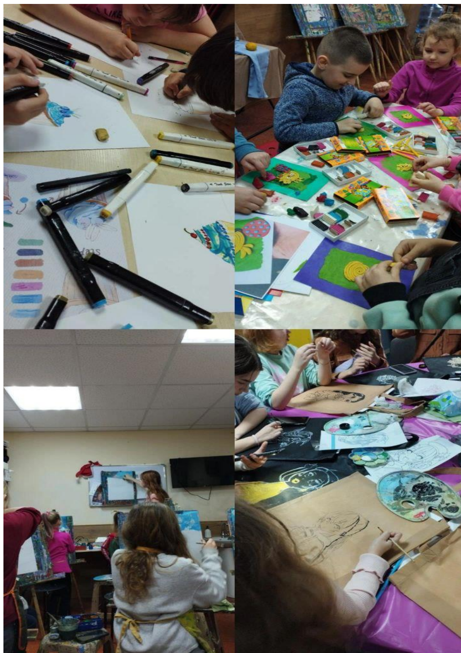
Рис. 3.1. Фото під час впровадження технології соціально-педагогічної допомоги дітям і молоді. Арт терапія

знайомство та заводити друзів. Стрес перед початком уроку або важливою подією зменшився, тепер діти сподіваються лише на хороший результат своєї праці та прагнуть підвищувати рівень знань.