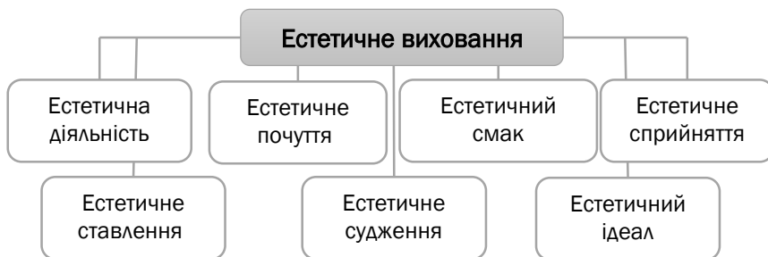
Рис. 2. Структурні компоненти естетичного виховання

Естетичне почуття – вищий вияв емоційного зворушення людини під впливом естетичних цінностей. Під час слухання музичного твору в слухача виникає емоція, співпереживання почуттям, які намагається донести виконавець та автор твору, залучається асоціативна, творча уява. Ритм, динаміка, тембр інтонація інші композиційні засоби мають великий вплив на емоційне сприйняття музики.